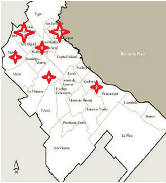
Mapa N° 1: Residencia de las Entrevistadas