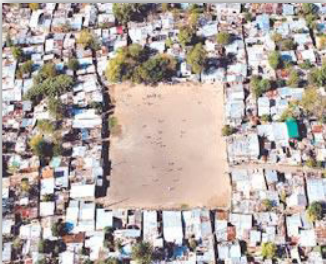
Imagen N°1: Villa La Caba