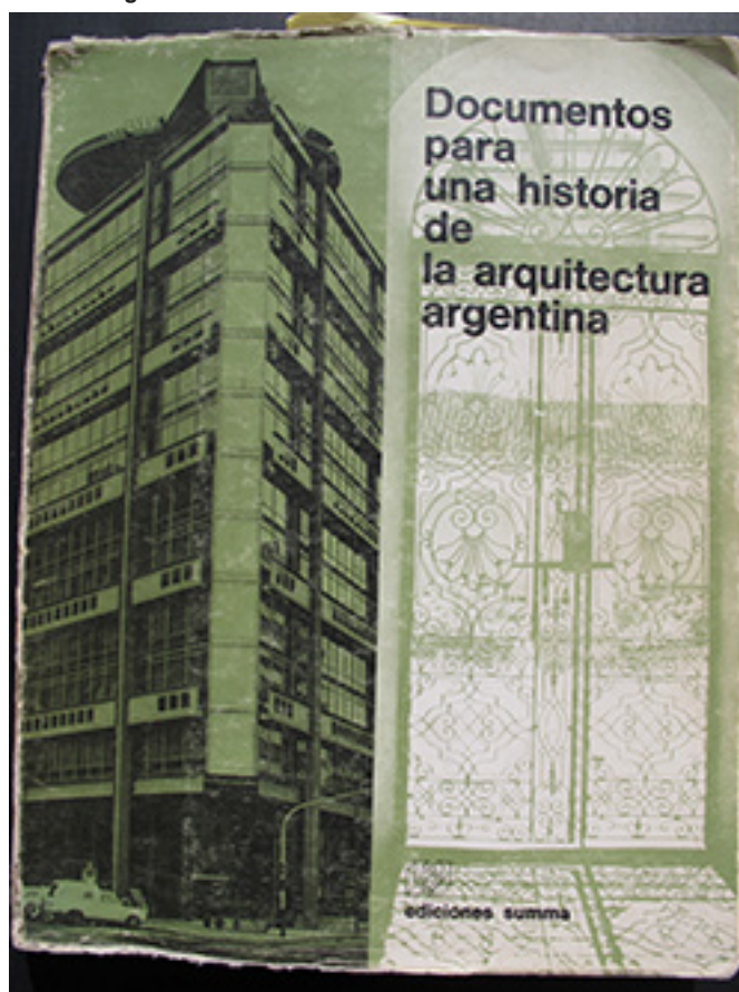
Figura 1: Portada de Documentos para una historia de la arquitectura Argentina