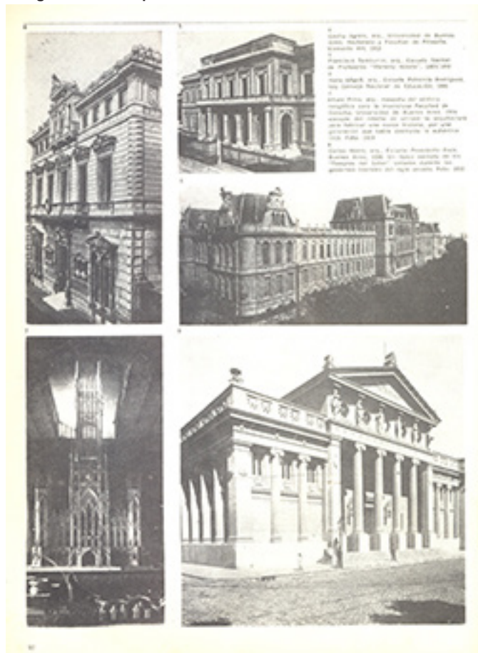
Figura 2: La “arquitectura” del liberalismo