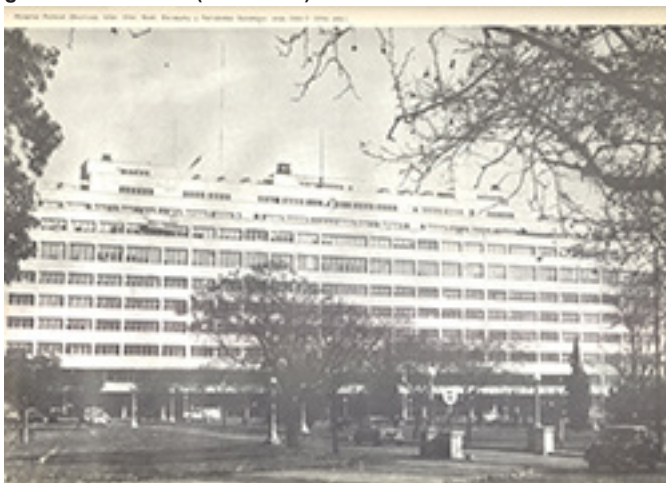
Figura 4: Arquitectura Moderna durante el periodo de “integración nacional” (1914-1943).