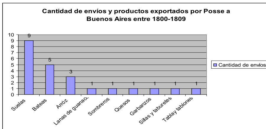
Gráfico N° 2