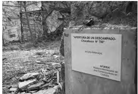
Figura 8. Una de las propuestas que más llamó la atención fue "apertura de un descampado", que consistió en la habilitación pública del ingreso a terrenos privados sin construir en la trama central de la ciudad.