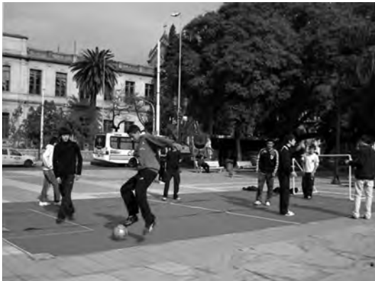
Figura 2. Montaje de sector de juegos en la plaza Colón.

Otra intervención importante en el 2010 fue la realizada por el Centro Cultural España Córdoba, organismo mixto dependiente de la Agencia Española de Cooperación Internacional para el Desarrollo y la Municipalidad de Córdoba. En octubre del 2010 organizó una Muestra Internacional de Arte Contemporáneo que se desarrolló en diferentes espacios públicos de la ciudad de Córdoba y en la que participaron destacados artistas provenientes de diversos lugares del mundo.