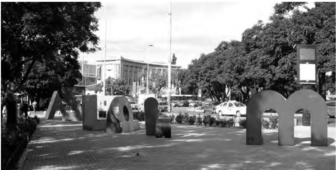
Figura 4. Letras móviles colocadas alrededor de la plaza España.