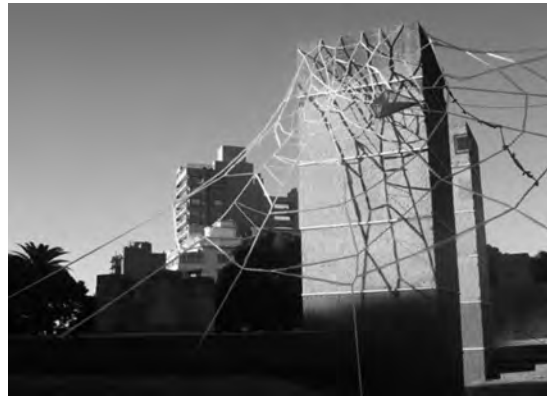
Figura 3. Intervención en la plaza España.