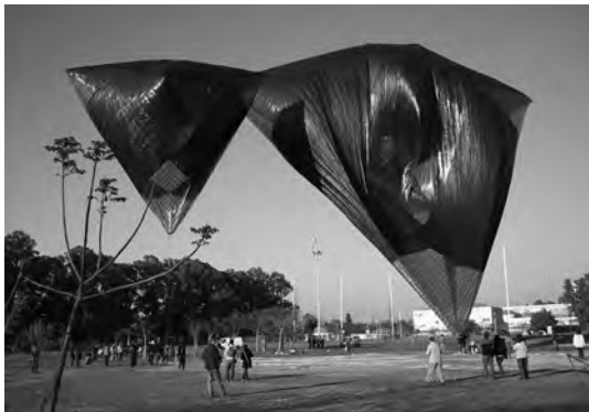
Figura 7. Intervención de un artista alemán invitado, en los espacios públicos de la ciudad universitaria.