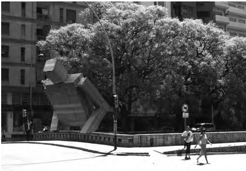
Figura 9. Intervención de Pablo Curuchet en la Cañada como símbolo del intercambio y la apropiación de los espacios públicos por parte del ciudadano.