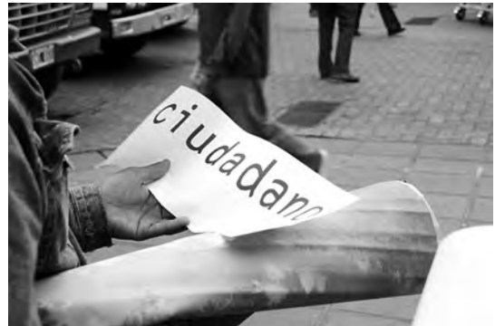
Figuras 5 y 6. Acción urbana realizada durante la muestra que consistía en un escenario móvil disponible para expresar ideas.