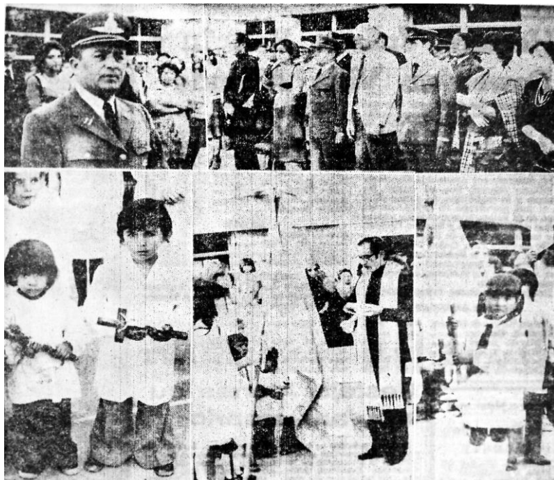
Figura 2. Imagen que acompaña la noticia sobre el “acto de desagraviar” llevado a cabo en la escuela. ( La Voz del Interior , 12/04/1978)

de los símbolos dañados y el intento ritual de reconstruir el respeto y la armonía en la comunidad. A este respecto los trabajos de Anderson (1993) han mostrado el carácter “imaginado” de la comunidad nacional, que supone la utilización de símbolos (banderas, escarapelas, condecoraciones, himnos, etc.) para obtener una legitimidad emocional profunda. El gobierno militar buscó “desagraviar” los símbolos patrios y religiosos supuestamente ofendidos, volviendo atrás lo sucedido a través de un ritual que requirió de ciertos ejecutantes, testigos y símbolos. De este modo, como sugiere Hobsbawm (2002), reinventar tradiciones implicaría un grupo de prácticas, normalmente gobernadas por reglas aceptadas abierta o tácitamente y de naturaleza simbólica o ritual, que buscan inculcar determinados valores o normas de comportamiento por medio de su repetición, lo cual implica automáticamente una continuidad con el pasado.