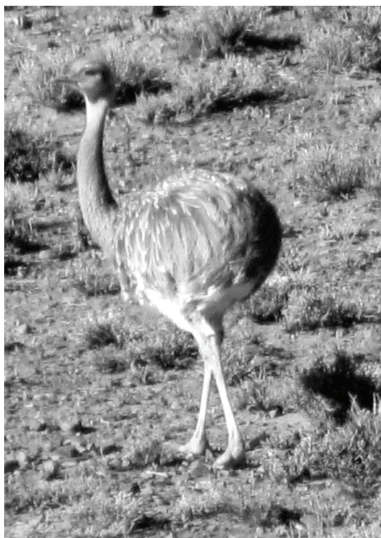
Figura 2. Individuo de Rhea tarapacensis fotografiado en la Reserva Privada de Don Carmelo.