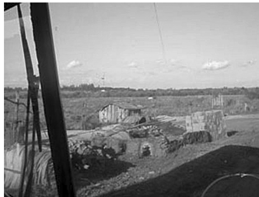
Algunos relocalizados volvieron a asentarse a la vera del arroyo Caimán