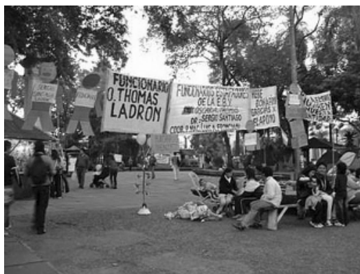
Carpa de protesta de vecinos del barrio El Brete. 2007

El grado de organización de estos sectores es variado, ya que existen agrupaciones que tienden a la búsqueda de reconversiones laborales o a reclamos orientados mediante la