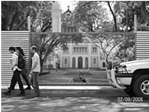
Obra en construcción. Remodelación de la plaza 9 de Julio.

La segunda se orienta a la construcción de viviendas estatales de interés social ubicadas en las zonas periurbanas del departamento capital, basada en un sistema de acceso a la vivienda según una estratificación socioeconómica de la demanda.