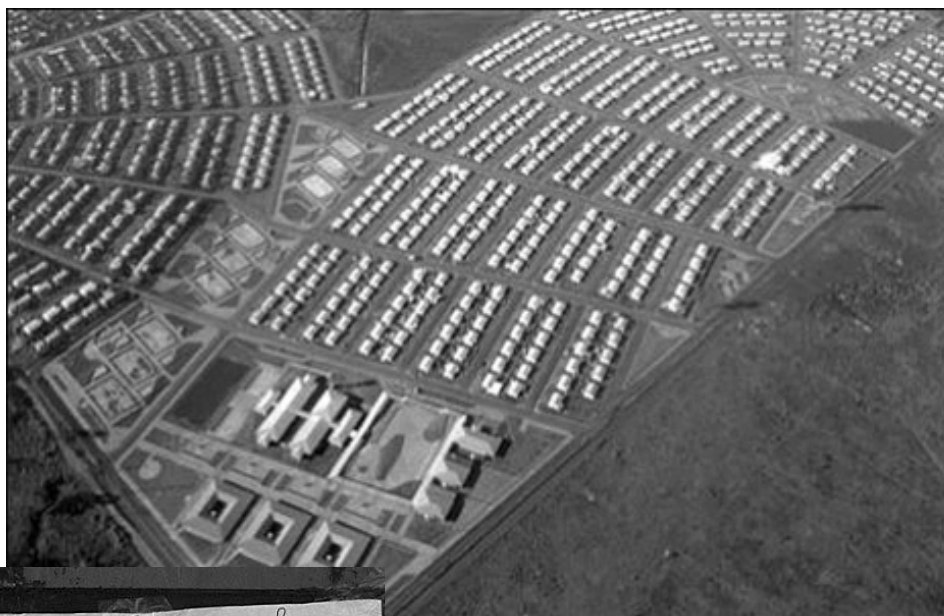
Barrios construidos por la EBY

CUADERNO URBANO. Espacio, Cultura, Sociedad – VOL. 8 – Nº 8 (Octubre 2009) pp. 117-136. ISSN 1666-6186