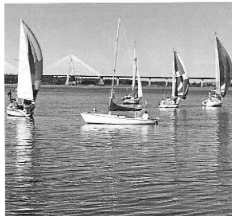
Actividades recreativas en la zona costera