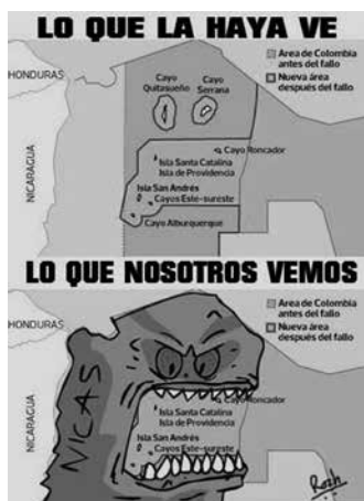
Figura 5. Caricatura sobre el fallo de La Haya

Hemos intentado reconstruir parte del proceso histórico, político y emotivo que ha sido antecedente del actual estado de la disputa territorial por San Andrés e islas aledañas, llamando la atención sobre la forma en que se ha pretendido establecer un dominio social y gubernamental. Hemos buscado proponer una voz que aliente la discusión sobre la