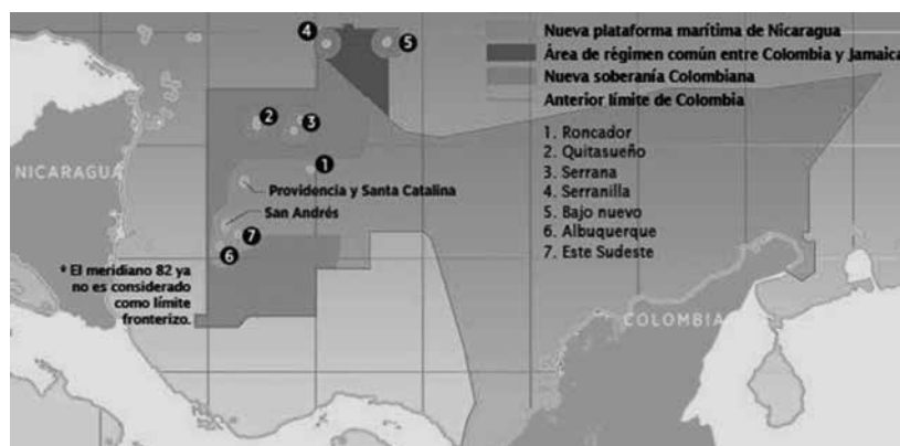
Figura 4. Nuevos límites marinos

Desacatos a normas internacionales, modificaciones tendenciosas de tratados e intervenciones en disputas internacionales, han sido posibles en la medida que los interesados cuentan con un sólido aparatage económico y militar (esto puede ejemplificarse más claramente con el caso de la construcción del canal de Panamá, mencionada secciones atrás). Tales formas de proceder, de los estados poderosos que se atribuyen actos de “justicia”, nos demuestran modos de acción bastante cuestionables que se amparan básicamente en la capacidad de ejercer la fuerza física. Sería “normal” que el mar concedido a Nicaragua termine siendo el marco del desarrollo de proyectos económicos de em-