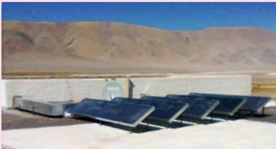
Figura 3: Calentadores solares instalados por INENCO en la comunidad de Tolar Grande, Salta.

El desarrollo de tecnologías que hacen uso de la energía solar continua, siendo un área de investigación relevante, sobre todo en lo que respecta al desafío de diseñar artefactos accesibles y robustos. Una de las instituciones científicas que viene realizando investigación en energía solar no convencional (incluyendo calentadores solares comunales u otros métodos como energía fotovoltaica) es el Instituto de Energía No Convencional (INENCO), de la Universidad Nacional de Salta (UNSa) y el CONICET.