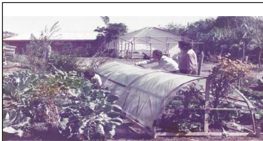
Figura 1: Experimentación con métodos agroecológicos en el Centro de Educación y Tecnología (CET), Chile durante la década de 1980.

El proceso de construcción tecnológica se basaba en métodos participativos que permitían a los usuarios definir parte del problema e intervenir en la construcción de mejoras o modificaciones en las tecnologías disponibles. El objetivo prin-