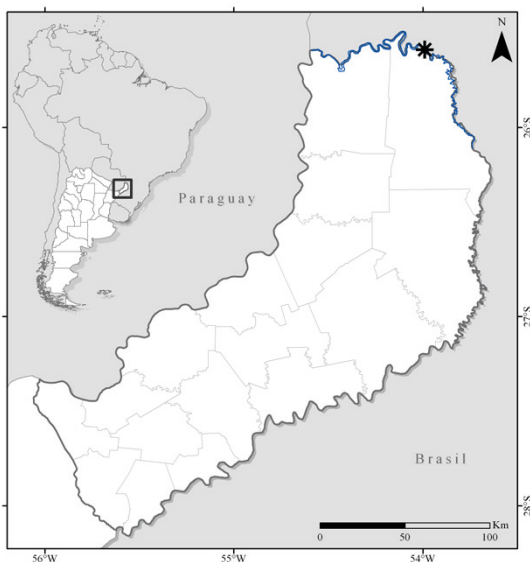
Figura 1 - Mapa de la provincia de Misiones indicando con un asterisco la localidad donde se registró Corydoras ehrhardti .

Material examinado. Colección ictiológica de la Fundación de Historia Natural Félix de Azara, Ciudad Autónoma de Buenos Aires, Argentina: CFA-IC-4481, 2 ejemplares, río San Antonio, cerca de su desembocadura con el Iguazú (25°35'18.78"S / 53°59'25.65"O), cuenca del río Iguazú (Figura 1). Colectores S. Bogan y J.M. Meluso. 02/05/2015.