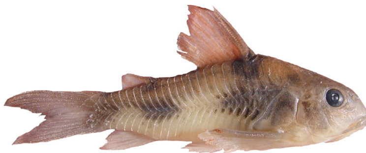
Figura 3 - Uno de los ejemplares de Corydoras ehrhardti (CFA-IC-4481) conservado en alcohol. La escala representa 1 cm.

Los ejemplares aquí reportados fueron colectados en las aguas del río San Antonio muy cerca de su desembocadura en el río Iguazú. Si bien gran parte del cauce de este río tiene fondo pedregoso, el área donde fueron colectados los ejemplares presenta fondo con sustrato fangoso. Los individuos fueron colectados con red de arrastre muy cerca de la orilla del río a una profundidad que va entre 0.20 a 1.65 metros aproximadamente.