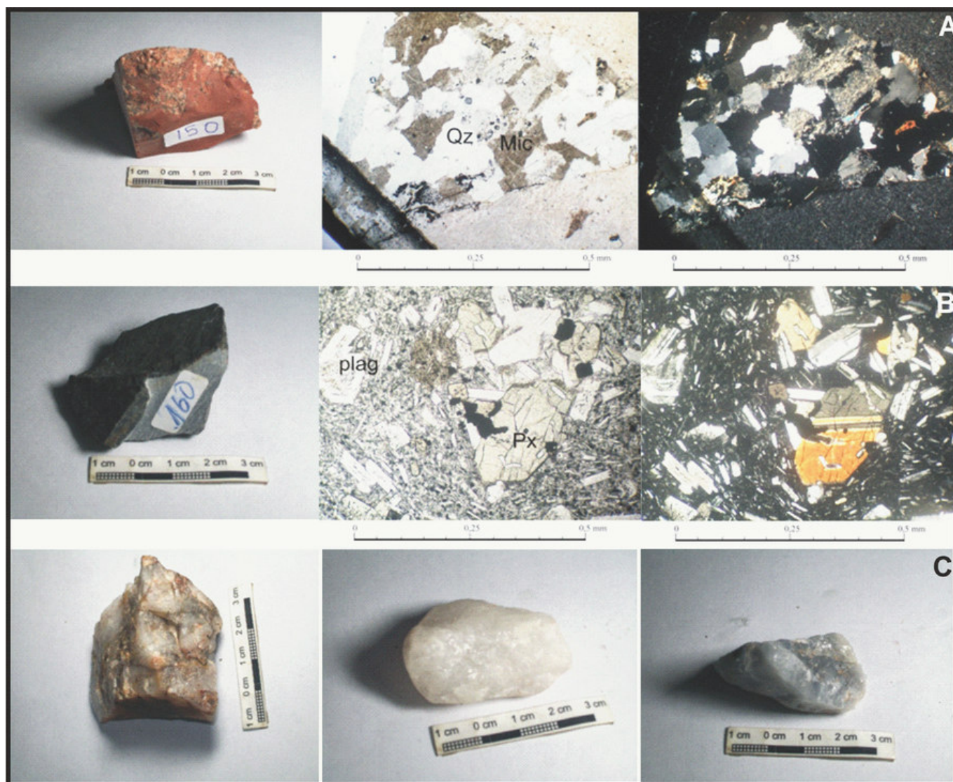
Figura 2: A) brecha sobre roca granítica y detalle de clastos graníticos con nicoles paralelos y cruzados (100x); B) basalto y detalle de cristales porfíricos de plagioclasas y piroxenos (100x); C) muestras de diferentes cuarzos.

petrográfico microscópico de cortes delgados. El estudio de las secciones delgadas fue realizado por el Lic. Miguel Blanco en el laboratorio de microscopía óptica del Instituto de Recursos Minerales (IN-REMI-UNLP). Se utilizó un microscopio petro-calográfico Nikon Optiphot Pol y lupa binocular Olympus SZH10 .