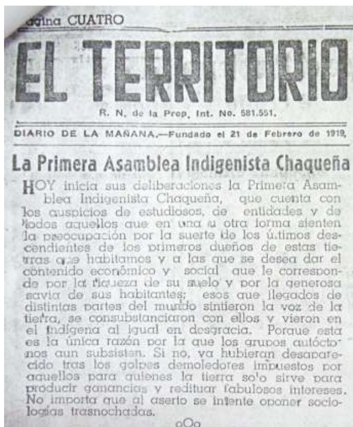
Fig. 2: Amplia cobertura periodística local sobre la Asamblea Indigenista Chaqueña.

En principio, un registro temprano de la militancia indígena chaqueña es la Primera Asamblea Indigenista Chaqueña, realizada en Resistencia entre el 1 y 3 de agosto de 1958. A diferencia del Congreso del Area Araucana que ya mencionamos, que se realizará cinco años más tarde, y en el que la presencia indígena se reduce a “notas de color”, la Asamblea Indigenista Chaqueña reunió en sus sesiones a “expertos”, políticos y activistas no indígenas y líderes indígenas de toda la provincia, predominando los tobas de la zona de influencia de Sáenz Peña, Quitilipi y Las Palmas.