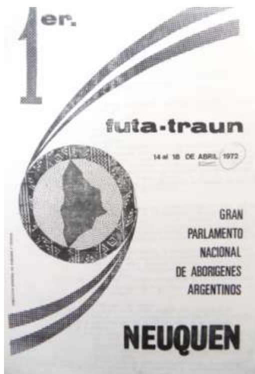
Fig. 5: Carpeta del Primer Parlamento Indígena 1972.

El Primer Parlamento Indígena Nacional Futa Traun fue considerado “un éxito” por sus promotores contemporáneos, a la vez que los testimonios actuales lo mencionan como un hito en la militancia, tanto por los participantes que logró aglutinar, la mayoría de los cuales por primera vez concurrían a una reunión de política indígena más allá de sus propias comunidades, como por los efectos que se le atribuyen en el tiempo.