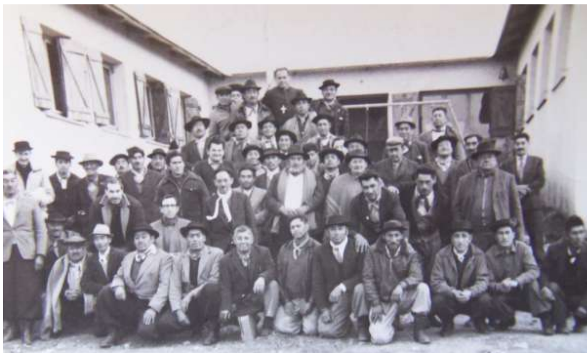
Fig. 1: Junio de 1970. Participantes del Cursillo en Pampa del Malleo, luego de conformada la CIN.