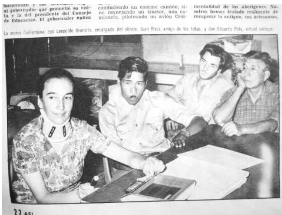
Fig. 4: Cobertura periodística de la visita de miembros de la Cooperativa Agroforestal de Nueva Pompeya a Buenos Aires.