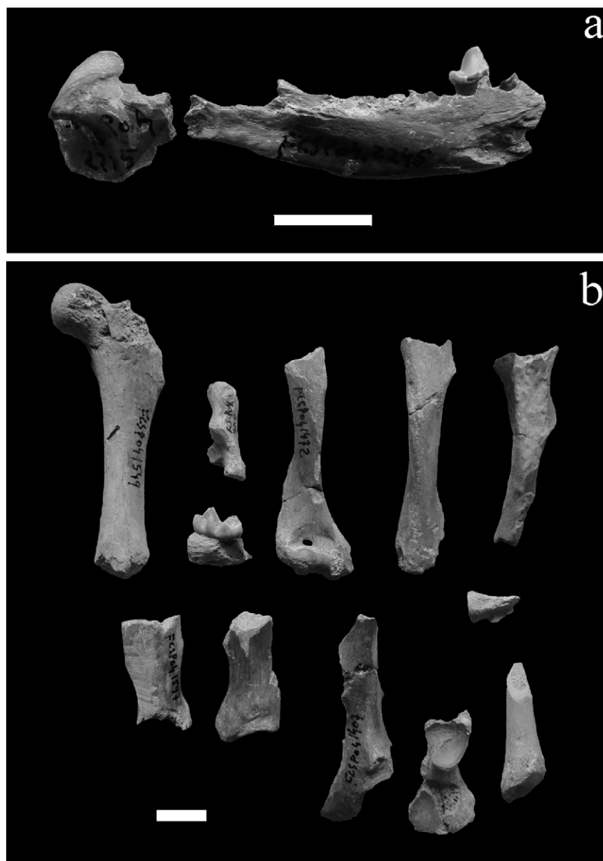
Figura 1. Especímenes de Conepatus chinga procedentes del sitio PO4. a) Niveles inferiores, b) Niveles superiores. Escala= 1 cm

de una hemimandíbula izquierda, el cual conserva el cuarto premolar in situ , así como la raíz del tercer premolar y las raíces mesiales del primer molar. El segundo espécimen (FCS.PO4.2215) es el cóndilo de esta hemimandíbula (Figura 1a).