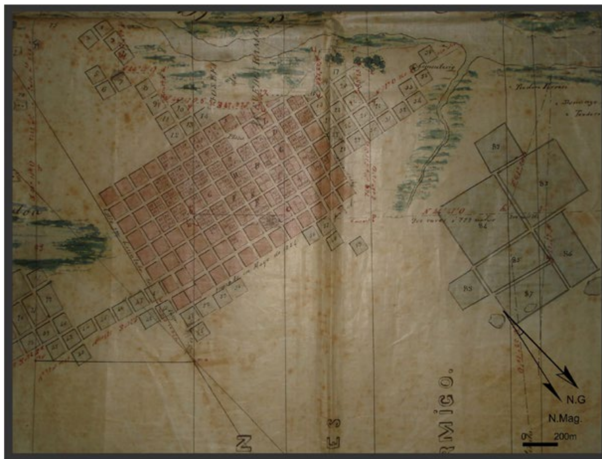
Figura 5. Detalle del plano del ejido de la Magdalena realizado por Pedro Benoit en 1860 (AHGyC, MOP, Exp. 34 de Magdalena).

La población del partido en el Censo nacional de 1869 cuantificó 7879 habitantes, de los cuales 1506 habitaban en el pueblo en 131 unidades censales. En el pueblo se registraron 87 casas de azotea, 13 de madera y 226 de barro y paja. Como puede notarse, era un pueblo pequeño y gran parte de la población residía en casas precarias. El plano, con una escala menor, no recogió las construcciones y sus ubicaciones en el pueblo.