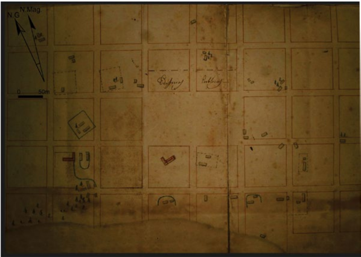
Figura 2. Detalle del plano del pueblo de Santa María Magdalena y una demostración de su traza, realizada por Saubidet en 1826 (AHGyC, MOP, Exp. 318.25.2).

de ellos presenta construcciones. Nueve conjuntos de edificaciones tienen cercados delimitadores de su espacio, posiblemente zanjeados o cercos vivos. El 80% de las construcciones se ubican, de acuerdo a la propuesta de traza, en el espacio destinado a los solares del pueblo, alrededor del 10% en la calle que oficia como circunvalación y que separa los solares y quintas, y el 10% restante en el espacio de las quintas. De acuerdo al código de colores utilizados por el Departamento Topográfico se destacan: la iglesia, ubicada en la manzana sur de la plaza, y una construcción en forma de L en el sector sudoeste del plano, cuya coloración indican haber sido de material y no de adobe, quincha o paja como el resto de las construcciones. Esta última construcción estaba asociada a dos conjuntos de estructuras de adobe, cinco de ellas concéntricas y mediante un zanjado se comunicaban con otras dos, las cuales podrían interpretarse como una posta.