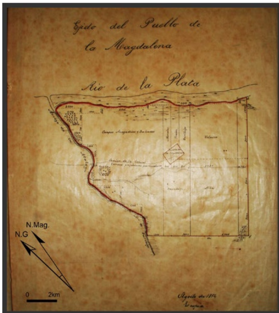
Figura 3. Propuesta de ejido del pueblo de la Magdalena, Arrufó 1854 (AHGyC, MOP, Exp. 12 de Magdalena).

los pueblos con su propuesta de traza y delimitar los límites de los ejidos (Canedo 2011). En el caso particular de estudio, en 1854 Jaime Arrufó, a cargo de la comisión Sur, realizó dos nuevos planos. En el primero, titulado "Plano del Ejido del pueblo de la Magdalena" 13 (Figura 3), el agrimensor delimitó el ejido, tomando los mismos accidentes naturales como límites aunque extendió su superficie hacia el sur de la cañada con respecto al plano de Saubidet. De esta manera, dos de sus lados resultaron irregulares por la presencia de cursos de agua, áreas de bañados y zonas anegadizas. En la mensura, aclaró que no podían seguir adelante por los inconvenientes de la topografía, por lo "fangoso del terreno y los espesos matorrales" 14 . Cabe señalar que si bien la ocupación ejidal era para la producción agrícola para el abasto, Arrufó señaló que este ejido estaba compuesto por tierras poco apropiadas para la labranza por ser anegadizas a lo que sumó la escasez de "brazos" para trabajarla. Indicó el camino a la capital y orientó el pueblo en relación al norte magnético.