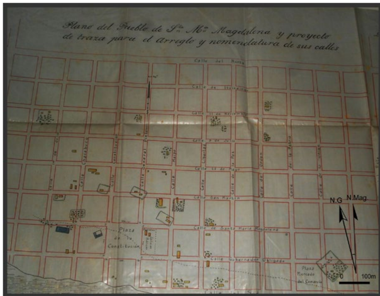
Figura 4. Plano del Pueblo de Santa María Magdalena y proyecto de traza para el arreglo y nomenclatura de sus calles, realizado por Jaime Arrufó en el año 1854 (AHGyC, MOP, Exp. 12 de Magdalena).

en sentido aproximado N-S, ya que según sus palabras ocasionaba el menor perjuicio posible y consideró que esto era así porque previamente se había seguido una orientación similar.