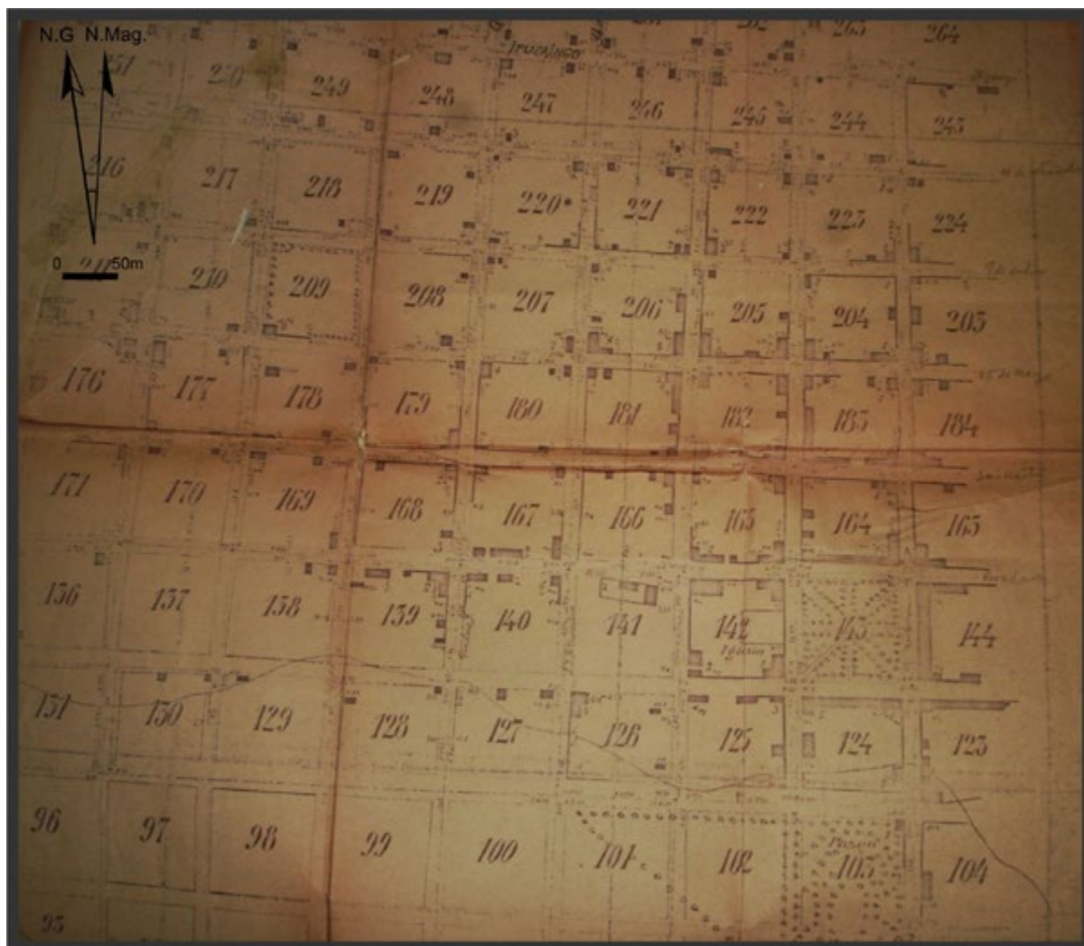
Figura 6. Detalle del plano de Magdalena de Gironde y Castex realizado en el año 1877 (AHGyC, MOP, Exp. 84 de Magdalena).

menor calificado el que implementase la mensura, ya que la Corporación “teme” que debieran mover las poblaciones con el perjuicio que implicaba. Resulta llamativo que en la solicitud fundamentaron que la ayuda contribuiría al desarrollo del pueblo que, en sus términos, “ha permanecido estacionario por tanto tiempo, a consecuencia de la interminable cuestión de su ejido” 23 , situación que parecía en camino de resolverse por la voluntad de los propietarios de aceptar la propuesta municipal. Esto hace referencia a las expropiaciones de terrenos para la conformación del ejido, relatadas en las mensuras de Benoit. En esta oportunidad, el Departamento Topográfico otorgó 60.mil pesos para la mensura del ejido y pretendió que fueran devueltos con las ventas posteriores. El Departamento consideró que la suma era apropiada por “la configuración muy irregular del perímetro de dicho ejido y la naturaleza del terreno” 24 . Asimismo, la autoridad municipal pidió que se realizara la delineación y subdivisión de solares, quintas y chacras de acuerdo a la mensura de Benoit de 1867 “dejando según los rumbos del antiguo Pueblo por estar ya formado y poblado casi en su mayor parte” 25 . Este expediente puso en palabras cuestiones que hacíamos notar previamente: las dificultades para practicar las mensuras por las características del terreno y su poca idoneidad para la labranza, el escaso crecimiento del pueblo -contrastante con el desarrollo de otros pueblos de la campaña (Aliata