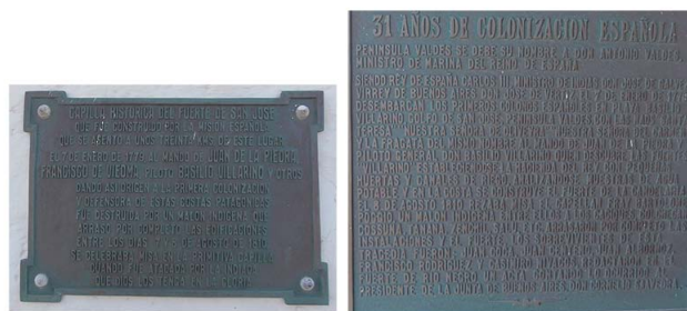
Figura 2. Placas conmemorativas en la réplica de la Capilla del Fuerte San José relativas (a) al malón que habría puesto fin al asentamiento y (b) al recuerdo de la gesta colonizadora.