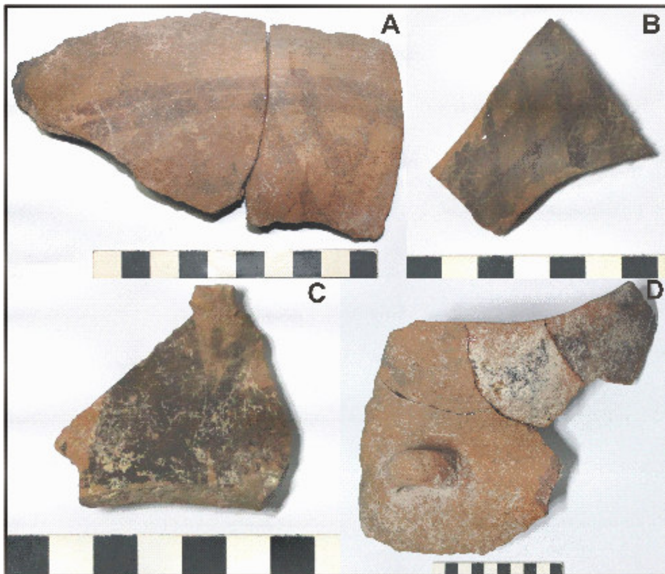
Figura 2: Material cerámico encontrado en el Recinto Rectangular 1 asignable al Periodo de Desarrollos Regionales.

En esta oportunidad nos centramos en los pulidores o litos no modificados con evidencia de uso antrópico (LNM) y que podrían estar relacionados con el proceso de producción de las vasijas cerámicas. Estos litos presentan modificaciones sobre su superficie como estrías y/o pulidos ocasionados por su potencial uso. El análisis en laboratorio incluyó igualmente estudios macroscópicos como también bajo lupa binocular.