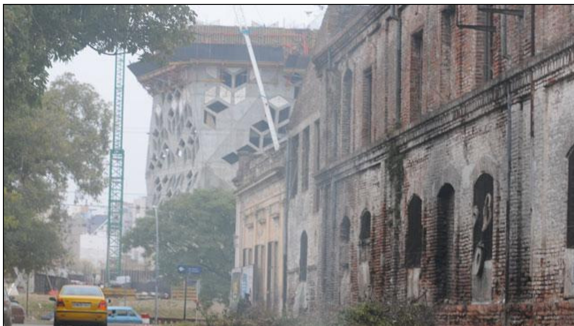
Fotografía 1: Avance de la construcción del Centro Cívico y parte del Barrio Juniors en proceso de revitalización .