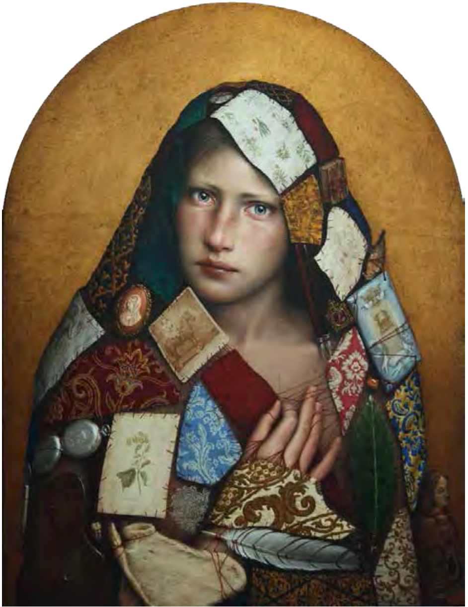
NIGREDO | Óleo y pan de oro / tabla | 62,5 x 48 cm. | 2010