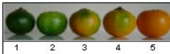
Figura 2. Grados de madurez de naranjilla

Para determinar el grado de madurez en la naranjilla normalmente se utiliza una escala de 1 a 5 (figura 2), según el desarrollo de color en la cáscara, donde 1= 100% verde (alcanzando su madurez fisiológica completa); 2 = 25% o ¼ de color amarillo-naranja; 3 = un 50% de color amarillo-naranja; 4 = un 75% de color amarillo-naranja y 5 = correspondiente a la madurez total de la fruta en un 100%, presenta toda la fruta en su cáscara de color amarillo (figura 2).