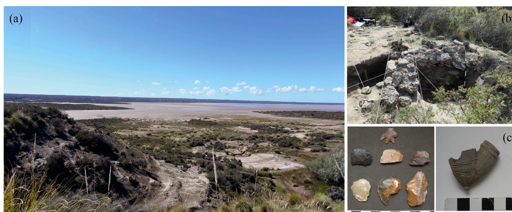
Figura 3. a) Vista de la Salina Grande, b) restos de una estructura de piedra identificada en el Puesto de la Fuente y c) artefactos líticos y pipa de cerámica de origen europeo recuperados durante las investigaciones arqueológicas (Fotos: Marcia Bianchi Villelli y Silvana Buscaglia).