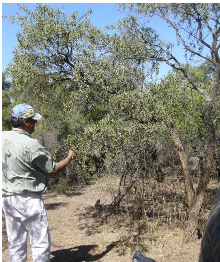
Figura 2 Caminata etnobotánica

de las plantas, los saberes relacionados a los usos de esas plantas, la vigencia de tales usos, es decir, si actualmente las seguían usando o no, y en algunos casos se indagó sobre formas de uso o partes de las plantas utilizadas. Finalizada esta etapa inicial del trabajo, se procedió, en los viajes siguientes, a la aplicación de entrevistas abiertas y semiestructuradas para indagar sobre aspectos específicos, como vigencia del uso, partes de las plantas utilizadas, formas de preparación y administración. Para esto se utilizaron fotos de visitas anteriores y tablas con nombres locales de plantas y en algunos casos se realizaron nuevas caminatas.