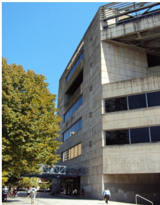
Uno de los laterales del nuevo Teatro 4

La década de 1980 comienza con un clima proclive a la consideración de la dimensión del patrimonio cultural-material 5 de la urbe. Eso se intensifica con la proximidad del centenario de su fundación, en 1982, cuando fue creada la primera norma general 6 , referente a los edificios anteriores a 1930, es decir, relativa a su prevención ante demoliciones, ampliaciones, cambio de uso parcial o total y modificaciones de las características principales de esos bienes inmuebles, sin el cumplimiento de la Comisión del Patrimonio Arquitectónico, Monumental y Urbanístico de La Plata (CPAMU). Esta Comisión también nació en el año 1982, con la función de gestionar todos los asuntos relacionados con la preservación del patrimonio cultural-material de la ciudad y fue posteriormente remplazada por el establecimiento de las direcciones de Arquitectura e Infraestructura Urbana y la de Obras Particulares y Planeamiento en 1985. Los impedimentos se extendieron a las propiedades municipales, parques, plazas y bulevares en el año 1983.