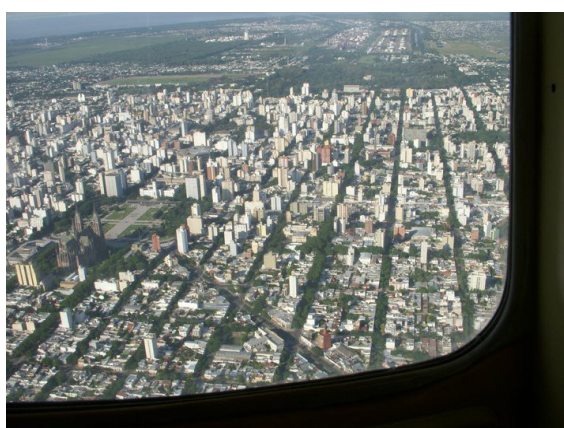
Vista aérea de La Plata 15

simbólica , articulada entre el lenguaje pasado y contemporáneo, para proteger las prácticas sociales actuales (Melo, 1998: 33). El propio proceso de urbanización es algo continuo y no se “congela”. No obstante, tal proceso debe estar reglamentado por las instancias de poder público, buscando una salida armoniosa entre desarrollo/preservación. En el caso de La Plata, su status en cuanto urbe planificada genera discusiones sobre la manutención del modelo estipulado por sus proyectistas, hacia fines del siglo XIX, y las modificaciones que ocurren fuera de este patrón, relativas al propio crecimiento del Municipio y a la creación de nuevas necesidades de acuerdo con cada época.