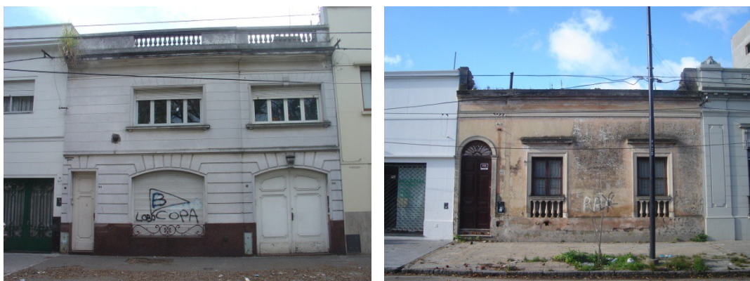
Dos casas platenses en estado de deterioro 7

A finales de la década de 1990, la Fundación Centro de Estudios y Proyectos del Ambiente (CEPA) propuso la candidatura de La Plata para el puesto de Patrimonio Cultural de la Humanidad, la cual fue aplazada por la UNESCO, debido, entre otras cuestiones, a los grandes cambios de arquitectura y paisaje que el área platense sufrió en las últimas décadas, además de la notable desatención de sus espacios patrimoniales.