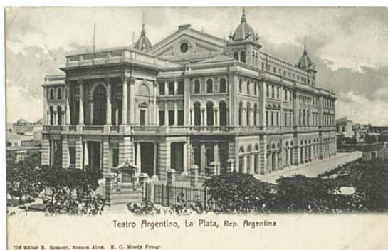
Teatro Argentino: edificio original 3