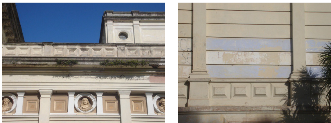
Museo de Ciencias Naturales 8

A finales de la década de 1990, la Fundación Centro de Estudios y Proyectos del Ambiente (CEPA) propuso la candidatura de La Plata para el puesto de Patrimonio Cultural de la Humanidad, la cual fue aplazada por la UNESCO, debido, entre otras cuestiones, a los grandes cambios de arquitectura y paisaje que el área platense sufrió en las últimas décadas, además de la notable desatención de sus espacios patrimoniales.