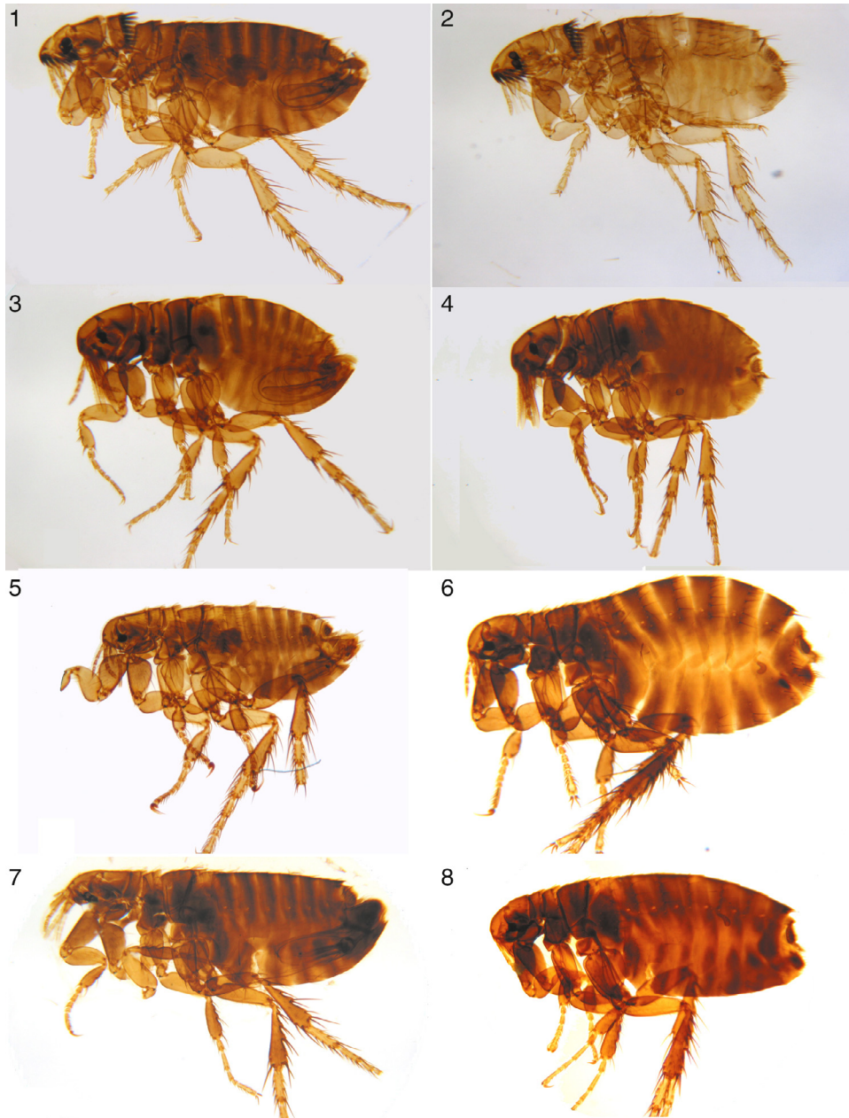
Figura 2. 1, Macho Ctenocephalides felis felis ; 2, hembra Ctenocephalides felis felis ; 3, macho Pulex porcinus ; 4, hembra Pulex porcinus ; 5, macho Rhopalopsyllus australis australis ; 6, hembra Rhopalopsyllus australis australis ; 7, macho Rhopalopsyllus saevus ; 8, hembra Rhopalopsyllus saevus .

2/IV/2010, col. V. Villalobos; 3 hembras 3/IV/2010, col. V. Villalobos; 2 hembras, Campeche, Pachuitz, acahual 720 m snm 2/III/2010, col. V. Villalobos; 2 hembras Campeche, 3/X/2010, col. V. Villalobos; 2 machos ex/ P. opossum Campeche, Nuevo Bécál, acahual 600 m snm 6/III/2010, col. V. Villalobos; 1 hembra ex/ U. cinereoargenteus Campeche, Pachuitz, Selva mediana 600 m snm 3/X/2010, col. V. Villalobos.