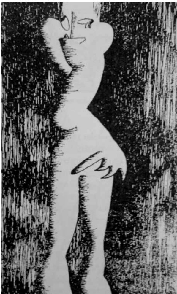
(Experiència N°2: 42)

Es por eso que el peligro, el acercamiento al límite o a la muerte, es el que permite una experiencia que quiebra la unicidad en la que se asienta el sujeto moderno. Este se desdobra en dos personalidades, un yo-crítico y un yo-miedoso, que componen una “criatura extraña” ( Experiència N°2 42) la cual, como ilustran los dibujos que acompañan el texto, se descompone mental y corporalmente.