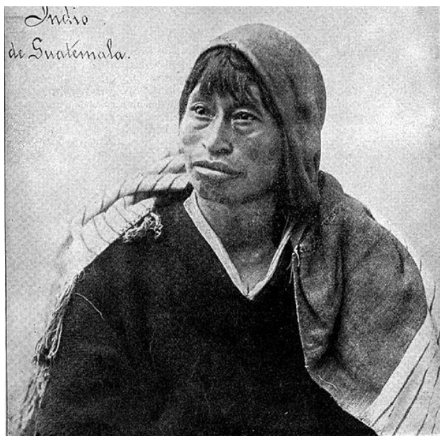
5. Anónimo, Indígena de Guatemala, en Darío González, Geografía de la América Central, Guatemala, Imprenta Nacional, 3ª edición, 1889.

tanto paradójicas y seductoras, hay una distancia temporal que nos separa y nos acerca. 49