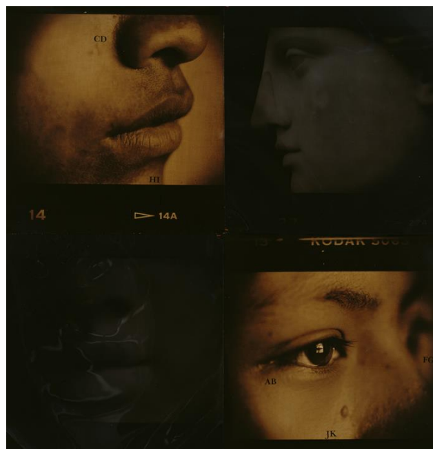
4. Luis González Palma, El Reflejo , 1998, fotografía ortocromática y lámina de oro, 100 x 100 cm.

González Palma parece reconocer este aspecto problemático de la visualidad dominante en la retratística y en sus superposiciones históricas con la práctica artística. (Fig. 5) En su obra, es el énfasis en la mirada como poder y la exploración de la visualidad moderna/colonial lo que le permite abordar estos cruces de manera crítica. (Fig. 4)