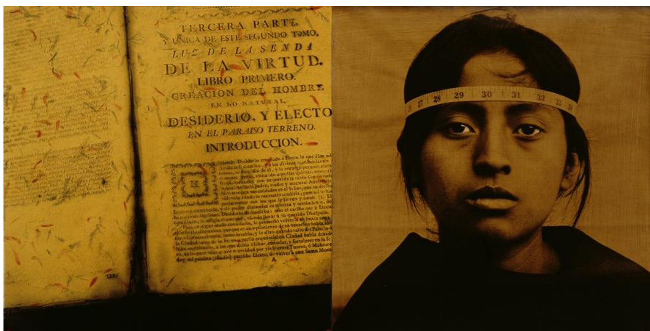
6. Luis González Palma, La Mirada Crítica , 1998, fotografía y técnica mixta, 50 x 100 cm.

En la medida en que la obra pone en marcha un cuestionamiento sobre los límites entre el arte como práctica artística y práctica etnográfica, hace posible una reflexión sobre el arte como práctica poscolonial, sobre su función en procesos de dominación que se originan en la conquista y continúan a lo largo de la situación colonial. Las imágenes que aluden a la tradición fotográfica etnográfica a través de la utilización de convenciones y elementos formales propios de la fotografía positivista de fines del siglo XIX denuncian el rol cómplice del arte en la dominación colonial a través de diferentes