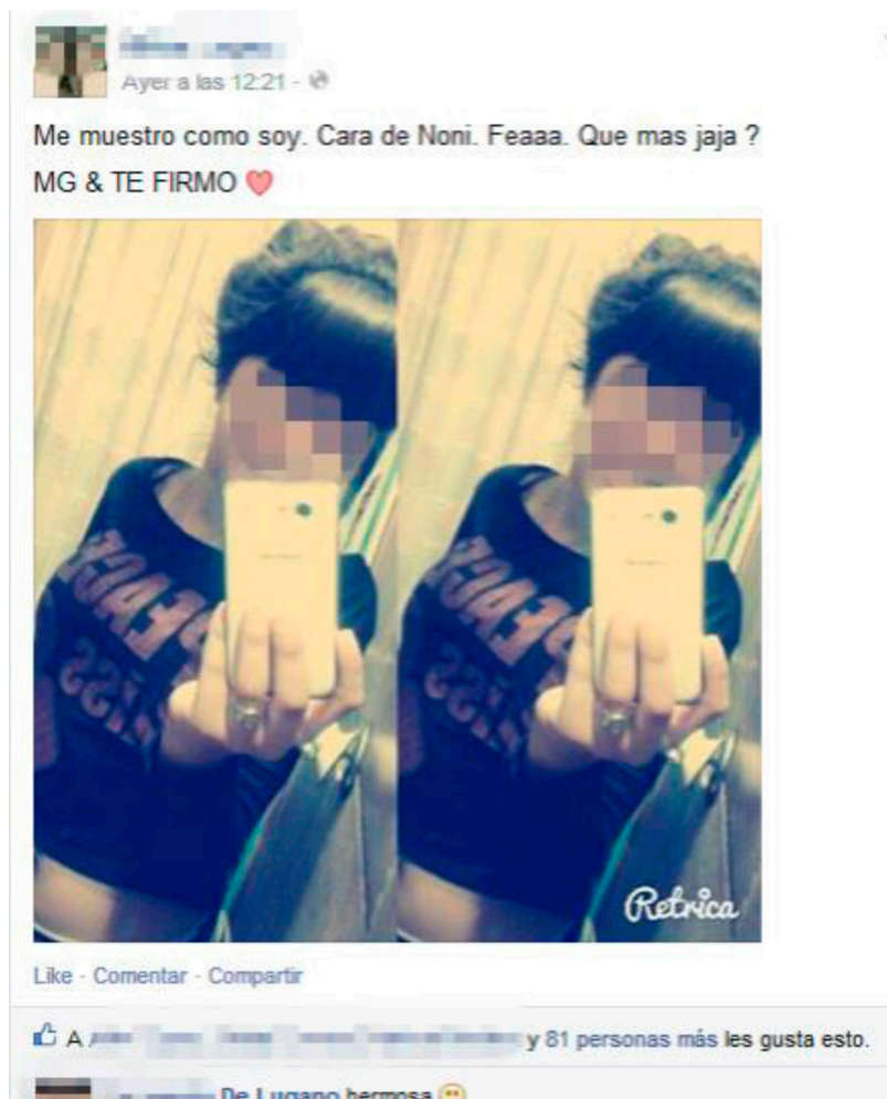
Captura de pantalla de publicación de Facebook