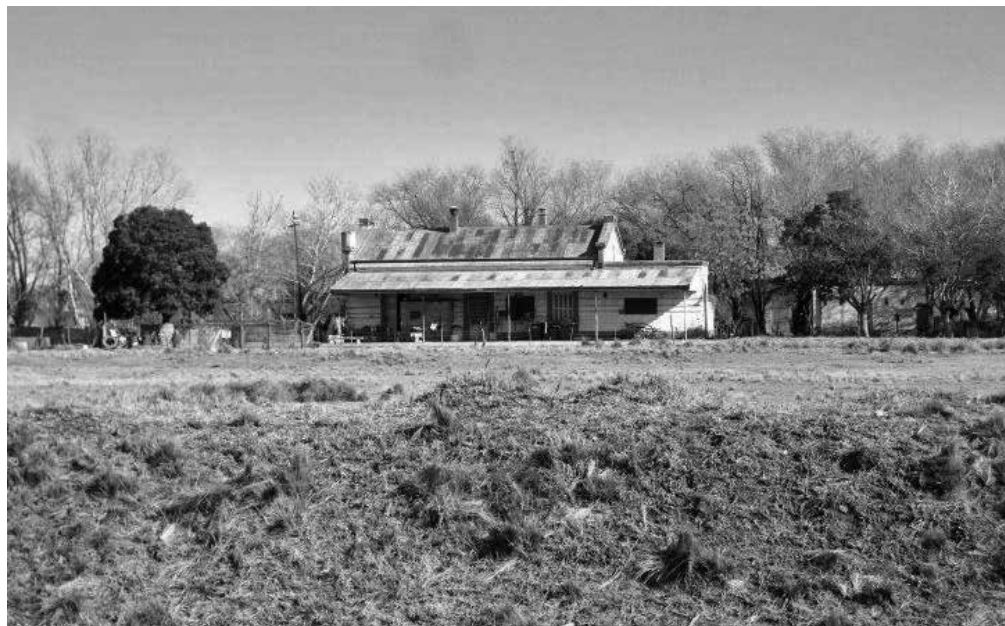
Figuras 3 y 4: Estación de tren

cambista o “ayudante de vía” y del “guarda hilos” o de la persona encargada del mantenimiento de la infraestructura de comunicaciones, un sector de corrales destinado antiguamente al encierro de ganado, las ruinas de una báscula y los galpones de acopio (Figura 2). Además de ello, se puede identificar determinado equipamiento ferroviario que aún se conserva en el sector, parte del cual es un tanque para abastecimiento de agua a la