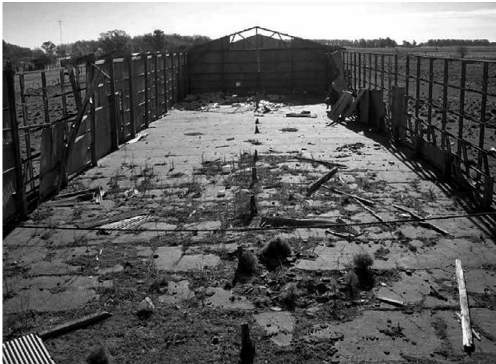
Figuras 5 y 6: Antiguo galpón de acopio

locomotora, algunos carteles de señalización, los cambios de vía y los propios rieles.