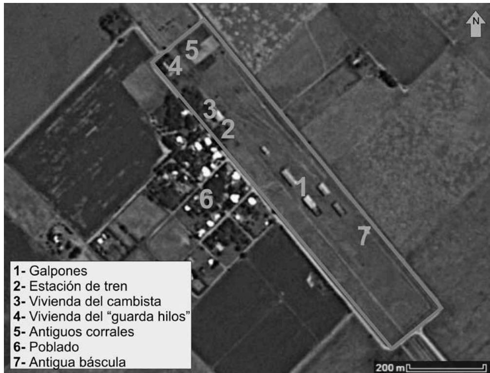
Figura 2: Croquis del complejo ferroviario