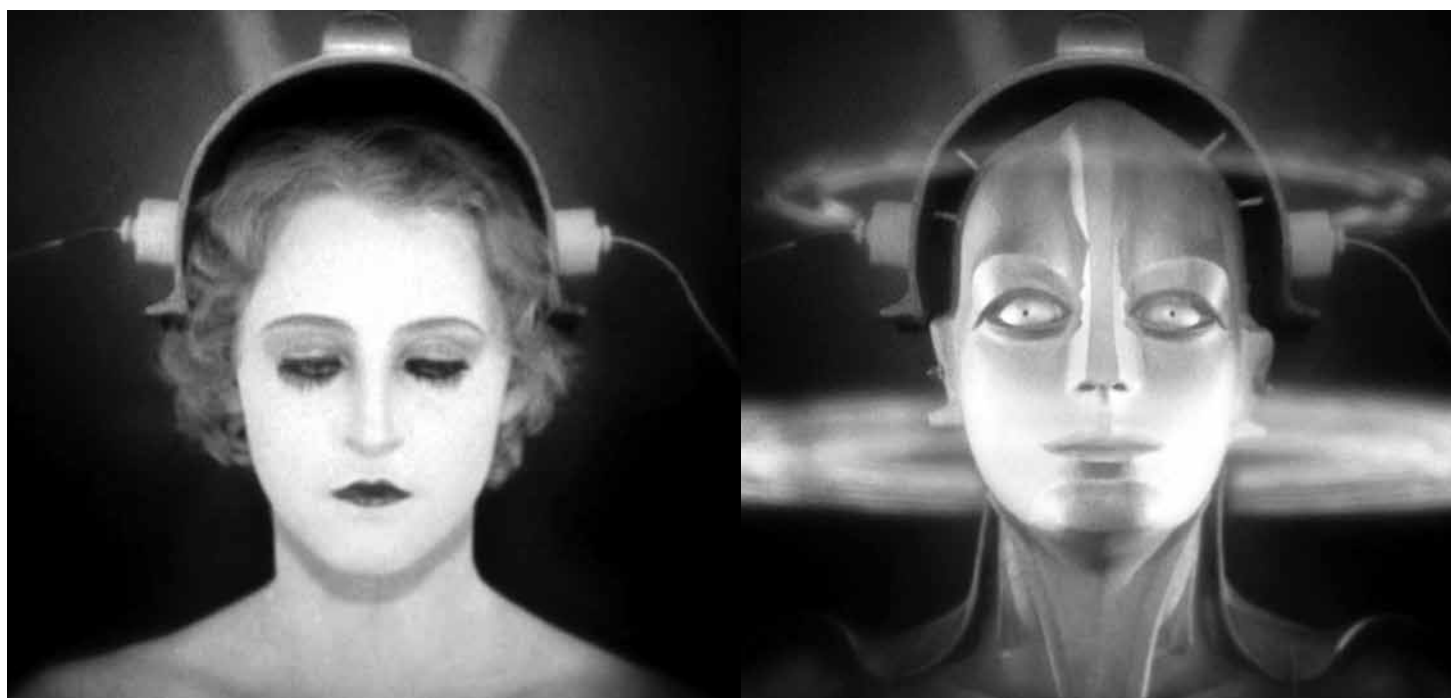
Metropolis , 1927 | DIRECTOR: FRITZ LANG

De este modo, el mecanismo de evaluación combina dos variables: para los más jóvenes, cuántas veces han sido primeros autores en revistas del primer grupo y, para los más experimentados, cuántas veces han sido último autor en las publicaciones más exitosas. Estos mecanismos se combinan, en la actualidad, con herramientas más sofisticadas, como el popularizado “índice h de Hirsch” (índice h), que consiste en ordenar las publicaciones de un autor a partir del número de citas recibidas en orden descendente, numerarlas e identificar el punto en el cual el número de orden coincide con el número de citas recibidas por una publicación.