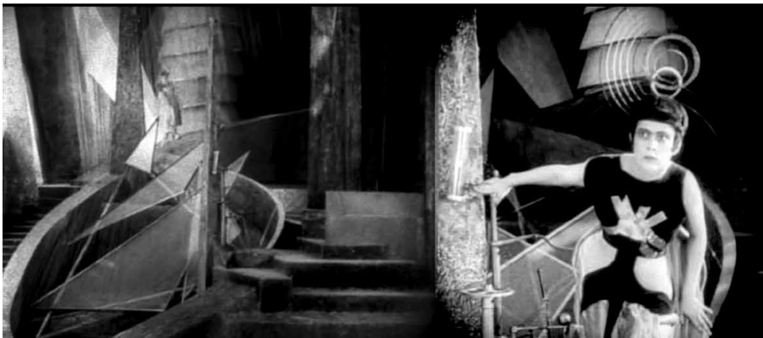
Aelita , 1924 | DIRECTOR: YÁKOV PROTÁZANOV

A lo largo del siglo pasado se fueron estableciendo algunas creencias colectivas sobre las cuales se fueron asentando diversas prácticas sociales, organizativas, institucionales y políticas de la ciencia. Estas creencias eran ampliamente compartidas y atravesaban las diferentes perspectivas teóricas e, incluso, disciplinares. Como ejemplo, podemos mencionar dos aportes muy influyentes desde los años cuarenta del siglo XX: el ya mencionado de Merton (1942), sociólogo funcionalista estadounidense, y el de John Desmond Bernal (1939), cristalógrafo e historiador de la ciencia inglés, de activa militancia comunista. A pesar de las enormes diferencias que uno podría imaginar — a priori —, ambos compartían la idea, según la cual, la ciencia era una actividad acumulativa, es decir,