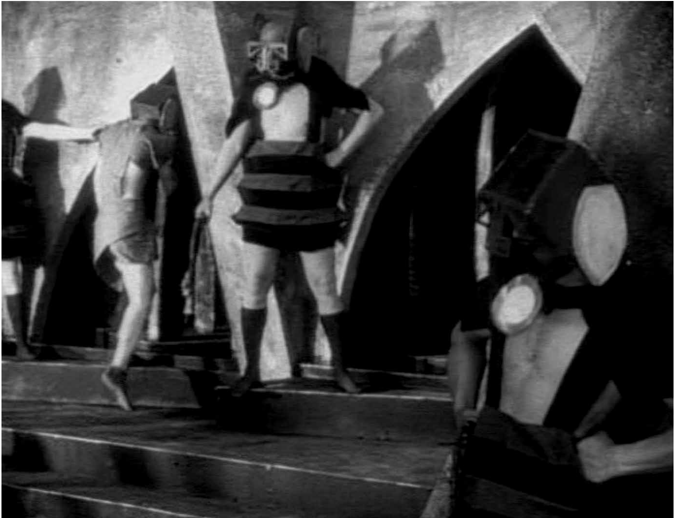
Aelita , 1924 | DIRECTOR: YÁKOV PROTAZÁNOV