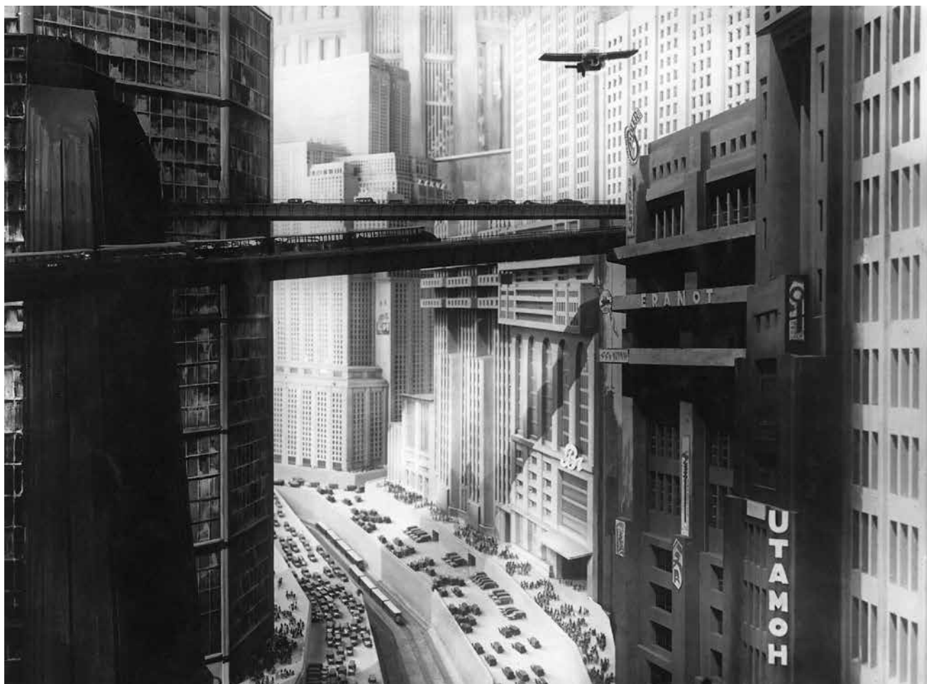
Metropolis , 1927 | DIRECTOR: FRITZ LANG

En líneas generales, las perspectivas constructivistas lograron establecer casi como un lugar común, aceptado incluso por quienes no suscribieron todos sus supuestos, que el conocimiento es, en efecto, una práctica social organizada en torno a creencias colectivas y atravesada por complejas relaciones entre dimensiones cognitivas, técnicas, sociales, organizativas, económicas, culturales, etcétera.