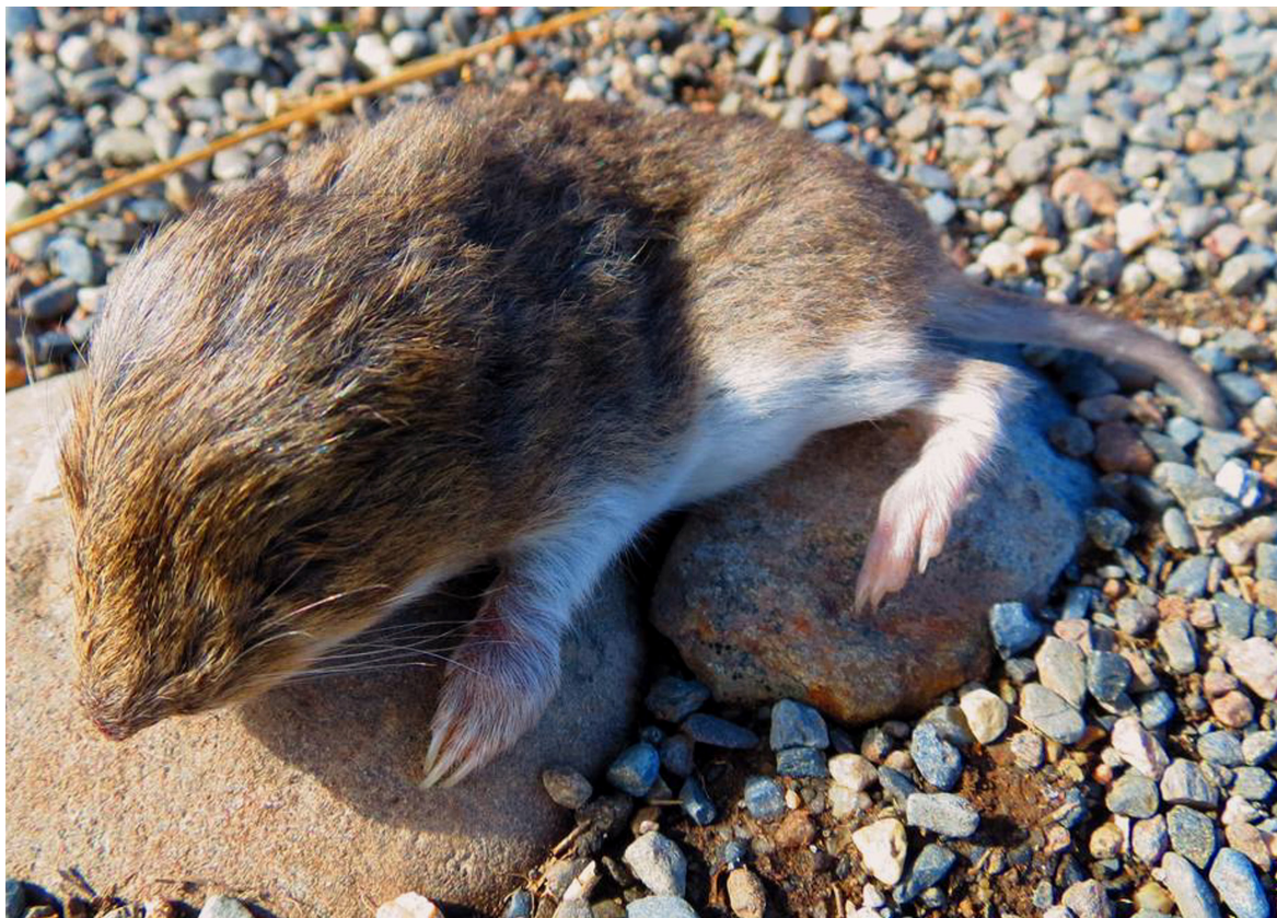
Figura 2. Vista externa de Notiomys edwardsii de Río Serrano, Parque Nacional Torres del Paine, Magallanes, Chile. Se destaca el contraste entre la coloración dorsal y ventral, la coloración anaranjada alrededor del hocico y en los flancos, las orejas pequeñas y escondidas en el pelaje de la cabeza y la cola corta (para otros caracteres, véase el texto).

Este nuevo registro muestra, una vez más, la necesidad de continuar con el trabajo de campo, aún de grupos considerados como bien conocidos como los mamíferos ( D'Elía et al. 2015a ) y/o áreas supuestamente bien conocidas como el sur de Chile (véase Osgood, 1943 ; Rau et al. 1978 ; Johnson et al. 1990 ). Para el Parque Nacional Torres del Paine, Johnson et al. (1990) han citado, pero sin indicar un ejemplar de referencia, a Chelemys delfini , otro ratón cavador de estatus incierto, pero que por sus características más probablemente se trate de un sinónimo de Geoxus michaelsoni ( Teta 2013 ; Teta et al. 2015a ). Así, en el sur de Chile se registran por lo menos tres especies de ratones de