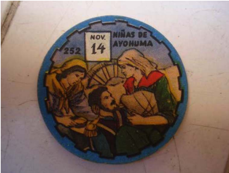
Figura 3 – "Las valientes mujeres de Ayohuma", Manantial . Libro de lectura para 4° grado, 1972