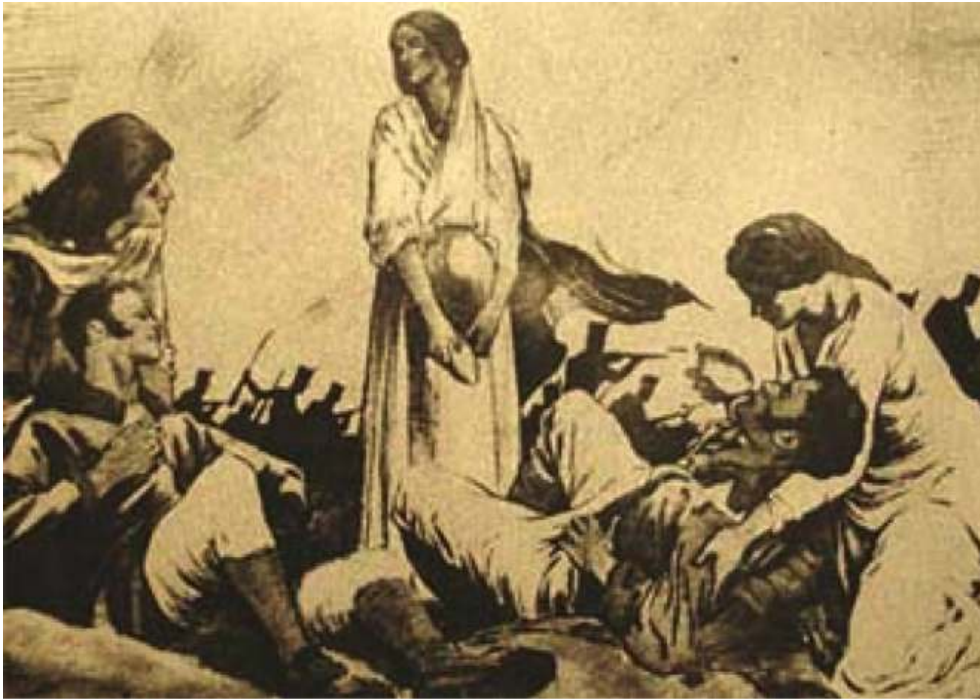
Figura 1 – Niñas de Ayohuma. S/f. Hasta el momento no se ha encontrado el original de esta foto, pero es la que más ha trascendido

49 Sobre ello es significativo considerar que en esta "desaparición simbólica" de los afrodescendientes no solo contribuyeron autores y textos canónicos de la construcción de la nación "blanca" y "europea", sino también periodistas, escritores, humoristas y dibujantes, a través de notas de actualidad, relatos de ficción, humor, chistes, fotografías, propagandas, cuentos y manuales escolares. Como lo ha explicado Alejandro Frigerio, los afrodescendientes fueron desapareciendo a través "de estas diversas arenas discursivas y gráficas con éxitos y velocidades diferenciados desde fines del siglo XIX hasta entrado el siglo XX". 69 Las variadas representaciones de "Las Niñas de Ayohuma" pueden ser un buen ejemplo de la significación que asumen las representaciones blanqueadoras en la invisibilización de los afrodescendientes de la escena pública argentina. A través de las figuras 1,2 y 3, correspondientes al siglo XX, se observa que las representaciones desracializadas de las Niñas de Ayohuma son manifestaciones de la "desaparición simbólica" de los descendientes de africanos del escenario argentino.