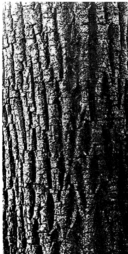
Foto N° 2: Cordia trichotoma (Vell.) Arráb ex Steud. Corteza fisurada.

Las hojas son simples; de filotaxis alterna (2/5); pecioladas: peciolo cilíndrico de 1,5 cm (0,5-2,2 cm) de largo por 0,24 cm de diámetro, pubescente con pelos simples y estrellados. Lámina de forma elíptica a obovada, más raro espatulada; de 15 cm (2-19 cm) de long. y 6 cm (2-7 cm) de lat.; borde entero a veces repando; ápice agudo o acuminado; base aguda, más raro cuneada. Superficie densamente pubescente en hojas nuevas con pelos simples, en algunos ejemplares vellosa. En las hojas adultas disminuye considerablemente la cantidad de pelos, estando presentes solamente sobre las nervaduras, simples y muy escasos en la cara adaxial, y en el envés con pelos simples y estrellados.