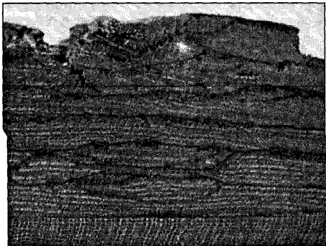
Foto N° 3: Cordia trichotoma (Vell.) Arráb ex Steud. Estructura cortical compleja, reticulado-flamiforme, 4 X.

Corteza persistente, fisurada, con fisuras rectas y domos planos, ritidoma de color castaño-claro a pardo-grisáceo, (Foto N° 2). Presenta estructura cortical compleja del tipo reticulado-flamiforme en la porción interna, el reticulado se extiende también en la corteza externa (Foto N° 3). La corteza interna se oxida rápidamente a un color castaño oscuro; la textura es fibrosa, (BOHREN et al., 2003).