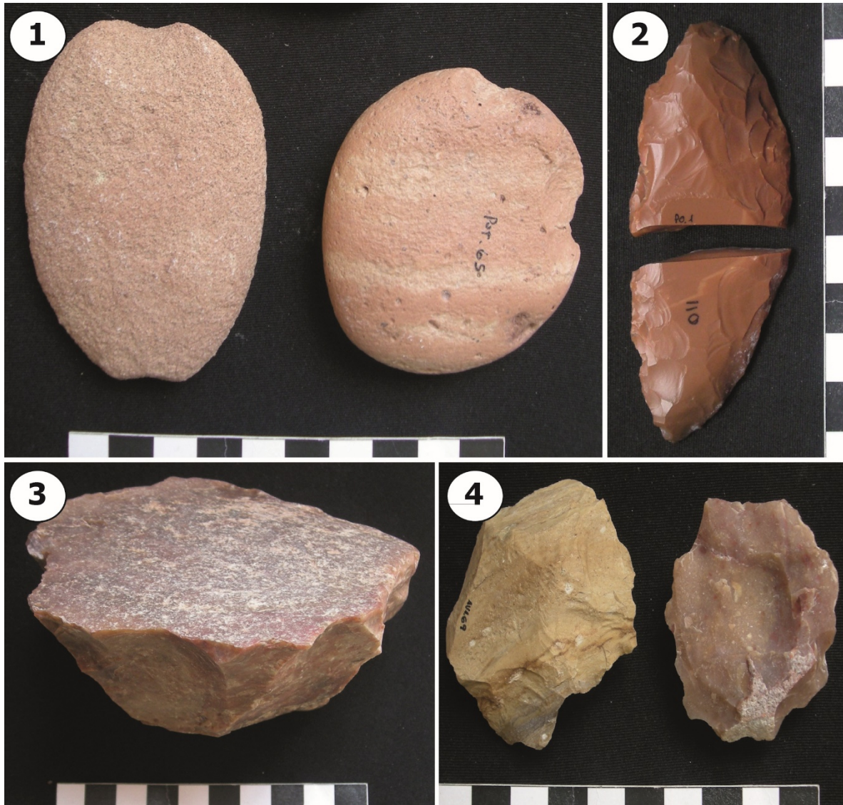
Figura 2. Artefactos recuperados en loci fechados en el bloque antiguo.

la frecuencia y porcentaje de artefactos de acuerdo con la calidad de las materias primas aptas para la talla de instrumentos (ver más adelante).