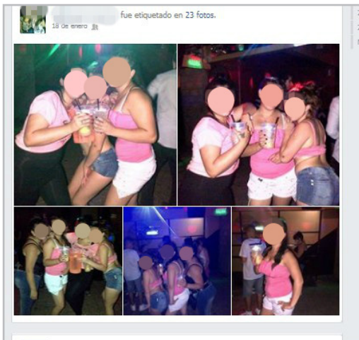
Figura 6. Sociabilidad nocturna