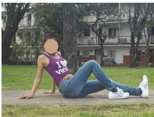
Figura 3 y 4. Foto-books

Al igual que en la autofoto, las adolescentes “testean” el nivel de eficacia de su imagen, a través de los comments que reciben de sus pares según la cantidad de MG y el nivel de aprobación de los comentarios. De este modo, los adolescentes disponen de dos herramientas fundamentales para la exhibición de sí mismos ante los otros: la cámara de fotos, que registra imágenes personales y permite publicarlas con facilidad sin costo alguno, y FB , que posibilita publicar y obtener feedback de esas imágenes. Aquí se condensan el sentido lúdico, el estético y el sexual.