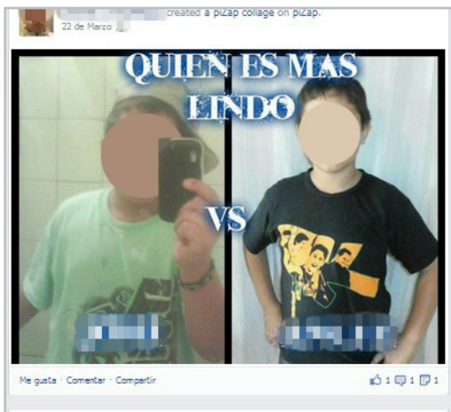
Figura 7. Duelos estéticos