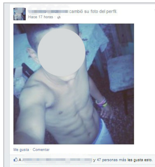
Figuras 1 y 2. Autofotos

Producidas con cámaras digitales, celulares o webcams , este tipo de performatividades (Butler, 2005) permite ensayar distintos tipos de femineidad y masculinidad, en un diálogo constante con el feedback de los comentarios del muro o los mensajes privados de los contactos de FB .