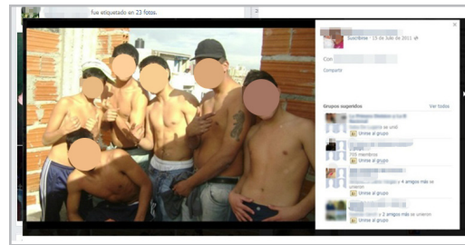
Figura 5. Sociabilidad diurna con pares