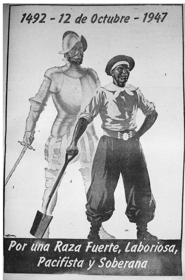
Figura 1: El Laborista , 11/10/1947, p. 11 (original de Héctor Alfonsín)

esta, El Laborista publicó una buena cantidad de notas que apuntaban a las raíces indígenas del mundo criollo. Una de ellas, por ejemplo, destacaba “el sentido político del folklore” como depositario de la “argentinidad” y su importancia para asegurar la “unidad racial” en una sociedad “que aún no ha podido definir su tipo étnico”. Aunque el texto no se detenía a describir el tipo étnico anhelado, la ilustración que lo acompañaba, de indios nortños, completaba el sentido. 38 La relación entre las “reservas de la provincianidad” canalizadas a través del folklore, indispensables para fortalecer la nacionalidad, y el aporte de “viejas civilizaciones indoamericanas”, fue objeto de otras intervenciones. 39 En algunas ocasiones el periódico incluso celebró de manera explícita la contribución indígena en la nación, no sólo en el pasado sino también en el presente. 40 La filiación de los descamisados actuales con los “gauchos pobres” que, acompañados de “sus chinas”, marcharon a luchar por la independencia, también fue destacada. 41 Se ensayó incluso una curiosa etimología de la palabra “gaucho”, que situaba su origen en el araucano “gatchu”, cuyo significado era nada menos que “compañero”, saludo amistoso con el que recibían la visita de los “paisanos mestizos”