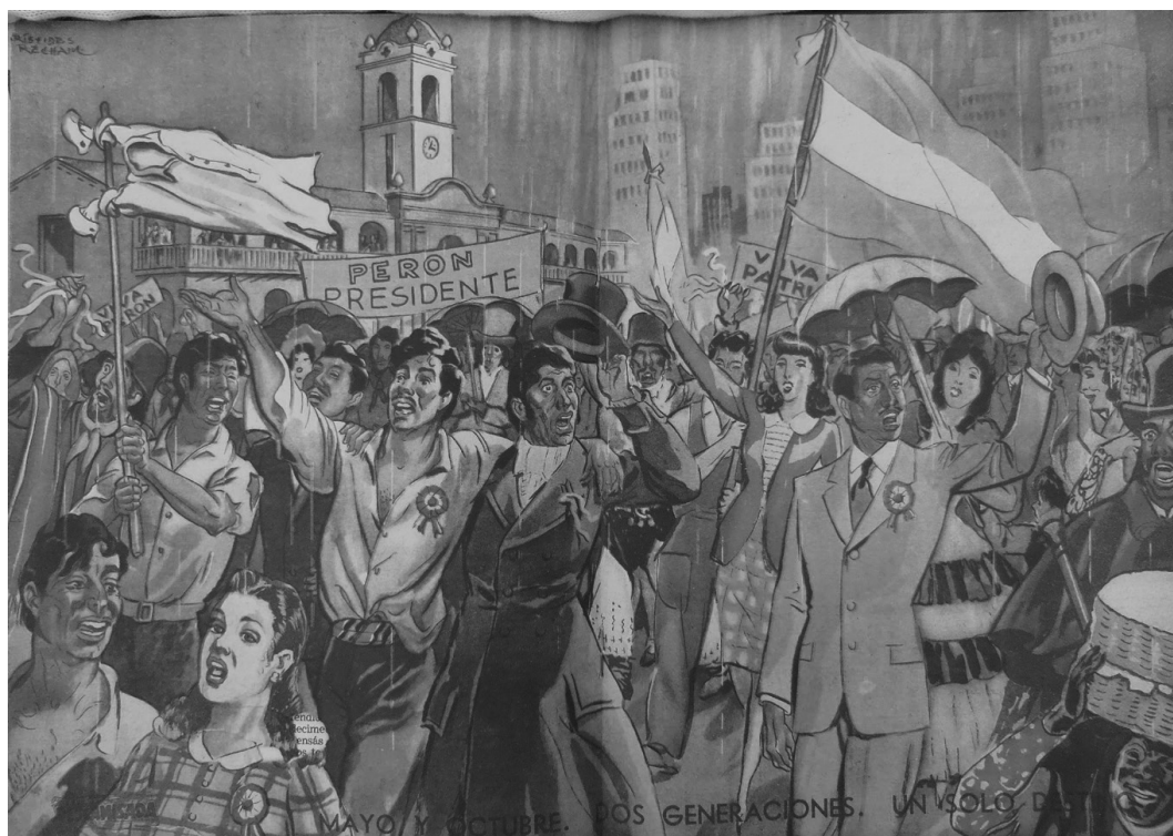
Figura 6: “Mayo y Octubre: Dos generaciones, un mismo destino”, Descamisada , no. 18, 20/5/1946, s/p.

En las representaciones gráficas o teatrales de lo popular también es posible encontrar ejemplos similares. En la exitosa obra teatral encargada por el gobierno a Cátulo Castillo, El patio de la morocha (1953), la canción principal describía a la heroína como una “muchacha criolla” de “cara bruna”. Por dar un ejemplo entre otros posibles, la continuidad histórica que decidió resaltar la revista Descamisada con el siguiente dibujo (fig. 6), asociando el 17 de octubre de 1945 con la Revolución de Mayo de 1810, contiene elementos que no podían pasar inadvertidos. 91