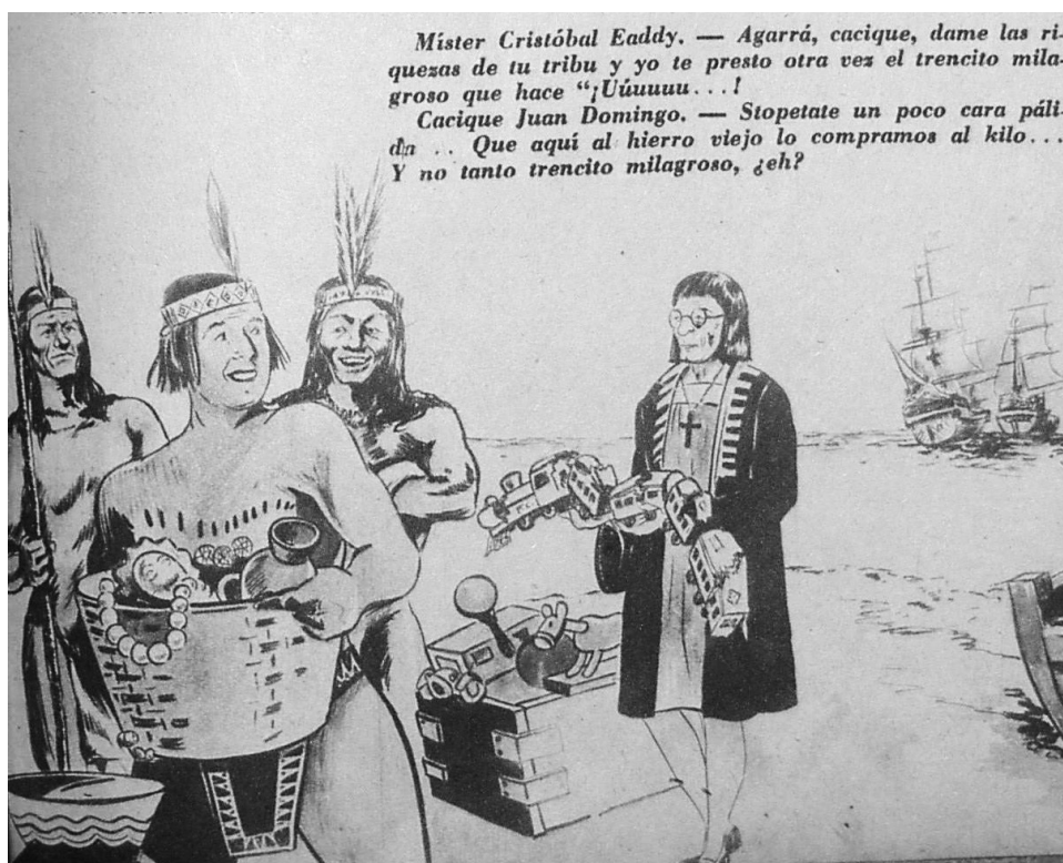
Figura 3: La negociación argentino-británica por los ferrocarriles en clave de la conquista de América: un Perón indígena defiende los intereses locales frente a un “cara pálida” ( Descamisada , no. 26, 31/7/1946).