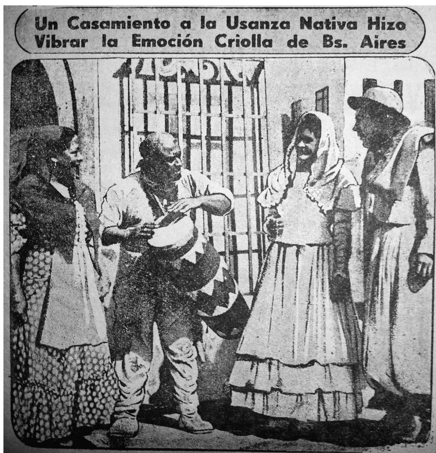
Figura 5: La pareja y los negros en la ceremonia gauchesca

cánones de la usanza nativa”. El novio, tucumano, era “una auténtico gaucho, varonil y apuesto”. La novia, riojana, “una hermosa morocha”. La ceremonia rebotó de motivos criollos: los novios, el padrino y el cortejo vestían a la usanza gauchesca. La novia llegó en una vieja carroza (el novio aclaró que no la trajo a caballo para no “extremar la nota”). Los invitados comieron un asado con cuero y bailaron gatos y zambas, todo enmarcado en una flameante bandera celeste y blanca. En fin, como agregaba el diario, la ceremonia nos trasladaba “a la época en que los auténticos atributos espirituales de nuestro pueblo eran expresiones puras de la nacionalidad”. Lo interesante es que, como anotó el cronista, “para que nada faltara, estaban también los negros”: un grupo de afroargentinos que tocaban el tamboril, vestidos con “colores chillones” (fig. 5). 63