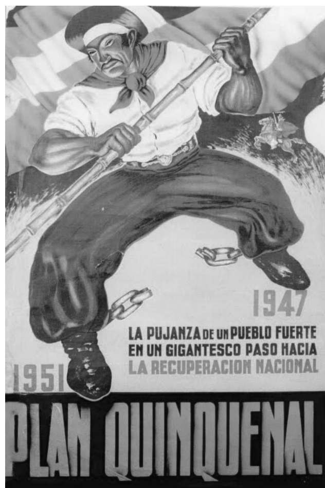
Figura 2: “Juan Pueblo”, tercer premio del concurso de afiches para el Plan Quinquenal ( El Laborista 10/6/1947, p. 8).

la ciudad de Buenos Aires y en los “gringos” y/o sus descendientes). El propio Perón parecía encarnar esa reivindicación. De él se decía que era un “criollo” ejemplar, un apelativo que no carecía de fundamentos. Había nacido y crecido en la campiña bonaerense, mezclado con la gente de campo. Cuando se recibió de subteniente en 1913, su padre le regaló un ejemplar del Martín Fierro con la dedicatoria: “Para que nunca olvides que, por sobre todas las cosas, sos un criollo”, un mandato que Perón juraba haber honrado. 54 Pero además, ya desde que se diera a conocer como hombre político circulaba la noticia de que su madre era “medio india”, lo que lo convertía a él mismo en mestizo. 55 En efecto, Juana Sosa de Perón era hija de una mujer tehuelche y de un hombre originariamente santiagueño, de estirpe quechua (de quien, además, se decía que había sido amigo de Juan Moreira). 56 Perón prefirió no insistir en público sobre su condición de descendiente de tehuelches por razones tácticas, aunque según un informante, era para él un motivo de orgullo. 57