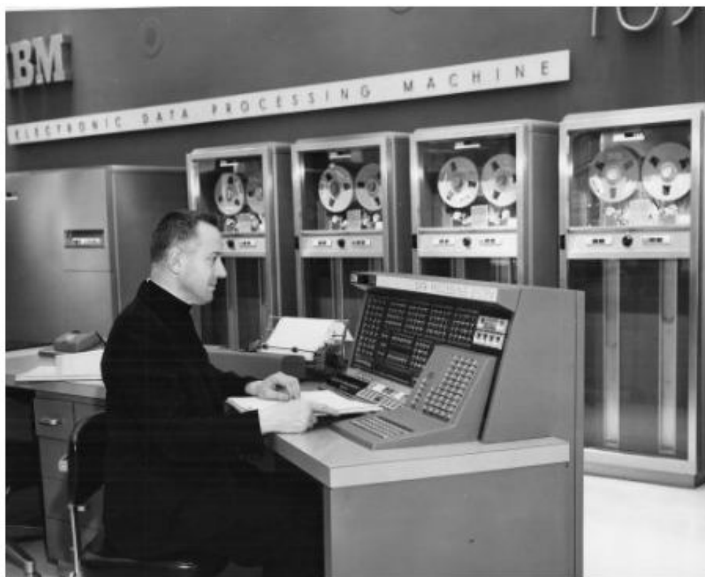
Roberto Busa, SJ, and the emergence of Humanities Computing.

El trabajo netamente positivista de Busa y Ellison sería el puntapié inicial para una etapa de casi cincuenta años, dominada principalmente por los intereses de la lingüística computacional y la edición de textos literarios, y desarrollada ininterrumpidamente en las universidades del norte de Europa, Estados Unidos y Canadá. La conformación de centros de investigación como el Literary and Linguistic Computing Centre (LLCC) de la Universidad of Cambridge (1964), la celebración del Congreso Computers for the Humanities? en la Universidad de Yale en el año 1965, cuna de la revista científica nacida un año más tarde,