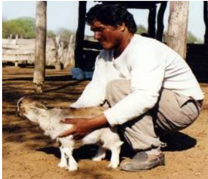
Foto N° 22. Falta de desarrollo en un cabrito con Bocio. Discusión y Conclusión:

Del listado de enfermedades que afectan a los caprinos la de mayor importancia fue la desnutrición, que se presentó en un 100% de las majadas con prevalencias y grados de desnutrición variables a nivel intra predial en las diferentes categorías de animales y estados fisiológicos reproductivos. Como factores desencadenantes de un estado nutricional deficiente se citan a la insuficiente disponibilidad de recursos forrajeros, alta carga animal, el pastoreo multiespecie en la misma parcela, sumada a esta situación se observó que la totalidad de las unidades productivas estudiadas no presentan cercos especiales para la contención de los caprinos. Esta falta de infraestructura posibilita el libre pastoreo, con recorrido de largas distancias que demandan un gasto de energía adicional y dan origen a un desbalance entre lo que ingiere en el pastoreo y el consumo de energía por el recorrido. También se pudo constatar la falta de implantación de pasturas y los