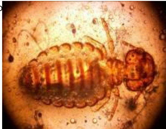
Foto N° 16. Piojo Masticador. En los animales infestados por garrapatas los ejemplares recolectados fueron clasificados dentro de la familia Ixodidae Rhipicephalus microplus y Amblyomma sp.

Por otro lado se observaron estadios adultos y juveniles de garrapatas de la familia Argasidae Ornithodoros rostratus en el suelo de corrales de caprinos de la Unidad Epidemiológica del Departamento Ramón Lista, no detectándose la infestación en los animales durante el examen clínico de la piel (ver foto N° 17 y 18).