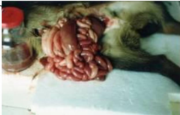
Foto N° 8. Lesiones intestinales en cabrito con enterotoxemia. La endoparasitosis