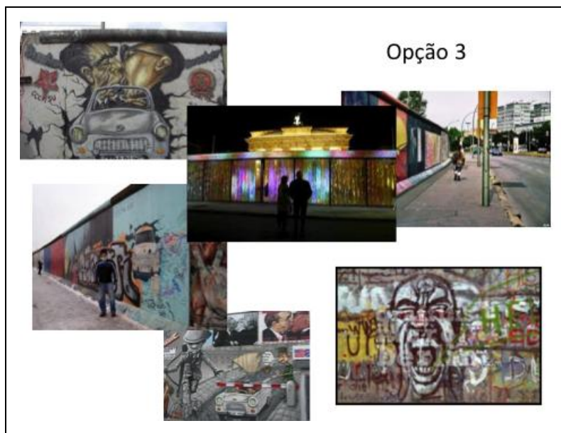
Figura 6: Una serie de artistas de todo el mundo intervino 800 metros del Muro, dando origen a la East Side Gallery.

Indudablemente, las tres opciones generan reacciones diferentes entre el público. Por ejemplo, en la East Side Gallery es frecuente observar reacciones de alegría, placer, diálogo, etc.. Mientras tanto, el muro desnudo y deteriorado de la primera alternativa contrasta con imágenes de seriedad y silencio. En última instancia, la huella del muro que forma parte de la segunda alternativa parece ser invisible para la mayoría de las personas, con excepción de los turistas que incluso evitan pisar la línea de adoquines.