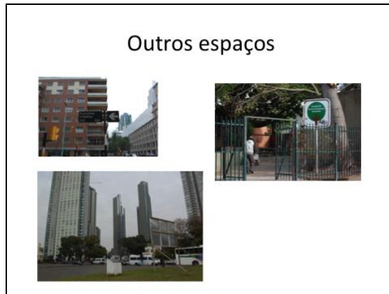
Figura 12: En los barrios de Puerto Madero, San Telmo y San Cristóbal se localizan pequeños espacios destinados a la conmemoración de las víctimas de la dictadura (como calles, canteros, plazoletas, etc).

En síntesis, los sitios surgidos durante la dictadura y aquéllos surgidos durante la democracia contienen un potencial diferente. Los primeros plantean un nexo directo con el pasado, al emplazarse en los mismos lugares donde se desarrollaron los hechos. Fueron instaurados por la fuerza de prácticas pasadas, y lograron proyectarse en el presente mediante nuevos actos. En los centros clandestinos de detención, la perversión de las detenciones ilegales y los crímenes instituidos como ejercicio común de la dictadura fueron seguidos por un proceso de denuncia, apropiación y resignificación. Los centros nos trasladan a otro tiempo, y nos enfrentan con la pregunta –a aquéllos que no vivimos directamente los hechos– de qué hubiéramos sentido de haber estado en esas circunstancias. Los espacios surgidos durante la democracia, incluyendo los parques y los espacios de pequeñas dimensiones, no son producto de actos desarrollados in situ en el pasado. Por este motivo, deben realizar otro tipo de esfuerzo para generar memoria desde el presente. Los parques parecen apuntar en este sentido. Sin embargo, algunos pequeños lugares (como los analizados para el caso de Puerto Madero, y San Telmo y San Cristóbal) aún no pueden cumplir de forma integral con el propósito planteado.