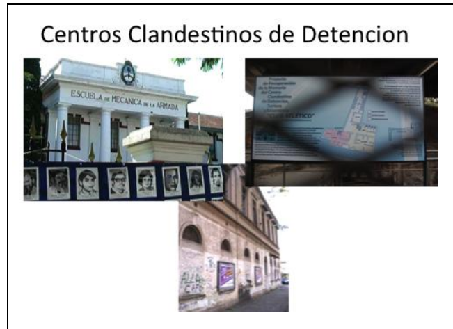
Figura 10: En Buenos Aires, los ex centros clandestinos de detención funcionan como espacios para la memoria.

En Buenos Aires existen algunos parques destinados al recuerdo de la dictadura y sus víctimas. Aquí referimos al llamado Parque de la Memoria (Figura 11). El lugar se encuentra alejado del centro de la ciudad, y no resulta extremadamente llamativo desde el exterior. Sin embargo, ofrece una experiencia particular para quienes lo recorren. El Parque posee un recorrido zigzagueante que representa la herida provocada por el terrorismo de estado sobre el tejido social (Comisión pro Monumento, 2007). El Monumento a las Víctimas se encuentra inspirado en el modelo americano de memoriales (HASS, 1998). Nos referimos al empleo de muros en los que se indica el nombre de la víctima. Las paredes aún presentan placas vacías, listas para agregar nuevos nombres a medida que se extiendan las denuncias. El monumento se transforma en un espacio en que las paredes, con sus miles de placas y nombres, parecen increíblemente extensas y transmiten la angustia de percibir las verdaderas dimensiones del genocidio (TAPPATÁ DE VALDEZ, 2003).