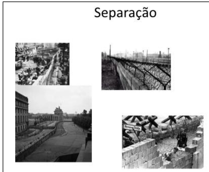
Figura 2: El Muro de Berlín en épocas de su funcionamiento.

La reunificación de Alemania fue consecuencia de la caída y posterior desaparición de la Unión Soviética, sumado a las crecientes exigencias de libertad de circulación en la ex República Democrática de Alemania (TAYLOR, 2006). El Muro de Berlín cayó entre el 9 y 10 de noviembre de 1989, como parte de lo que los alemanes llamaron “ die Wende ” (“El Cambio”). El ritmo de la reunificación marcó el compás del desmantelamiento. A principios de 1990, la ex República Democrática de Alemania comenzó a demoler la frontera de hormigón. En los meses subsiguientes, desapareció casi por completo la construcción más imponente de Berlín. El Muro se había transformado en un obstáculo que debía ser destruido (Figura 3). La ciudad tenía poco interés en preservar sus huellas, dado que la mayor parte de las historias en torno al lugar eran sinónimo de sufrimiento.