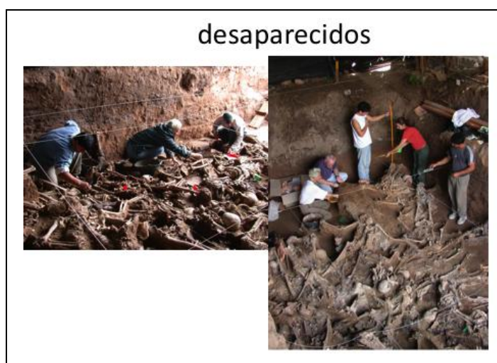
Figura 9: Los arqueólogos tuvieron un papel importante en la reconstrucción de la historia de la dictadura y los desaparecidos.

Con el retorno de la democracia, la sociedad demandó conocer más sobre lo sucedido. Se inició un proceso ligado a la construcción de una historia de la represión y sus víctimas que experimentó altibajos a lo largo del tiempo. Los arqueólogos tuvieron un rol importante en la búsqueda de los desaparecidos y el análisis de los centros de tortura y exterminio (DORETTI y FONDEBRIDER, 2001; ZARANKIN y NIRO, 2006; DI VRUNO, 2012; entre otros) (Figura 9). Desde hace aproximadamente diez años, las políticas estatales favorecen la designación, creación y/o gestión de espacios para la memoria a lo largo y ancho del país. Buenos Aires es la ciudad que más espacios de este tipo posee, y es en este lugar donde planeamos centrar nuestra atención. Los espacios para la memoria de Buenos Aires comprenden un conjunto de propuestas diversas (ZARANKIN y SALERNO, 2012). Algunos sitios surgieron durante la última dictadura y posteriormente fueron resignificados, como los ex centros clandestinos de detención. Algunos otros surgieron durante el período constitucional, como parques y otros lugares incluyendo plazoletas, placas, monolitos, calles, etc.