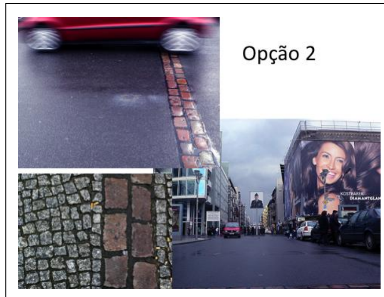
Figura 5: El Senado alemán propuso marcar el antiguo recorrido del Muro mediante una doble línea de adoquines y una serie de indicadores como placas, pilares, etc.

Finalmente, como tercera opción, un grupo de artistas de todo el mundo se reunió para expresar sus reacciones y sensaciones ante la caída del Muro. Así surgió la East Side Gallery. Creada en 1990, la Galería es un conjunto de decenas de pinturas que cubren un tramo de 800 metros de la construcción (Figura 6). Las obras representan la euforia y esperanzas de un futuro mejor. Esta tercera posibilidad se apropia de la materialidad de algo siniestro para transformarlo en algo distinto, algo que tiene belleza. Varias intervenciones artísticas urbanas, como los grafitis, parten de la posibilidad de reescribir la superficie de paredes y muros como forma de resistencia. Esos actos de reescritura suelen ser “ilegales”, en tanto no se encuentran amparados por el sistema. Las pinturas del muro, al contrario, tienen respaldo institucional como parte de una política “oficial” que también posee apoyo social. Lo que fue un espacio de opresión, un límite que separaba, pasó a convertirse en un lugar donde el arte crea libertad e invita a reflexionar a través de múltiples miradas.