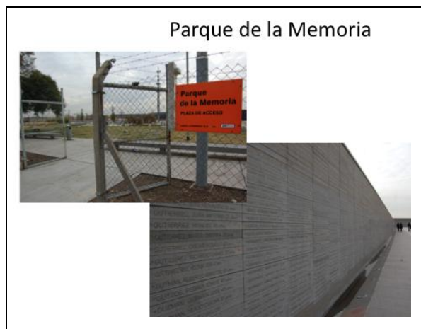
Figura 11: En la ciudad también se localiza el Parque de la Memoria, que contiene el Monumento a las Víctimas del Terrorismo de Estado.

La ciudad también alberga espacios para la memoria de pequeñas dimensiones (Figura 12). Los mismos se encuentran ampliamente distribuidos, aunque la mayor parte de ellos se concentra en dos barrios próximos pero contrastantes desde un punto de vista socioeconómico. En el caso de Puerto Madero, el barrio más nuevo de la ciudad, elegido por grandes compañías y ciudadanos acomodados, se localizan calles, un bulevar, canteros y estatuas que conmemoran a los desaparecidos. Mientras tanto, en San Telmo y San Cristóbal, áreas más postegradas, se construyeron plazoletas en los “espacios remanentes de la autopista” con un mismo propósito (Ley N° 1128/2003). En ambos casos, los espacios para la memoria comparten una situación de relativa invisibilidad. Los sitios se encuentran escasamente señalizados (muchos presentan un cartel sin más referencias que un nombre o una placa perdida en un espacio de mayores dimensiones), y están a la sombra de obras de mayor destaque. Al ser difícilmente reconocibles, aportar poca información, y despertar escasas emociones y sensaciones, tienen pocas chances de construir una narrativa sobre lo sucedido durante la dictadura.