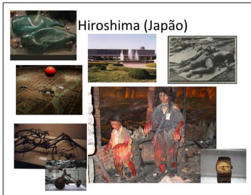
Figura 8: El Museo de la Paz de Hiroshima reúne objetos, imágenes y narraciones de las víctimas del bombardeo que impactan y conmueven a los visitantes.

El Museo Smithsonian del Aire y el Espacio, y el Museo de la Paz de Hiroshima son interesantes como forma de mostrar dos visiones contrapuestas sobre una de las mayores tragedias en la historia de la humanidad. De un lado, un simple avión antiguo, sin mayor información sobre el bombardeo. Para la historia oficial de Estados Unidos, los ataques atómicos representan el mal menor que permitió salvar muchas vidas (al contribuir a poner fin a la Segunda Guerra Mundial). Del otro lado, el horror explícito de una matanza indiscriminada y cruenta. La luminosidad y el brillo metálico, casi higiénico, de la máquina que lanzó la bomba son parte del lenguaje que se contrapone a la oscuridad, la destrucción, la suciedad de la muerte.