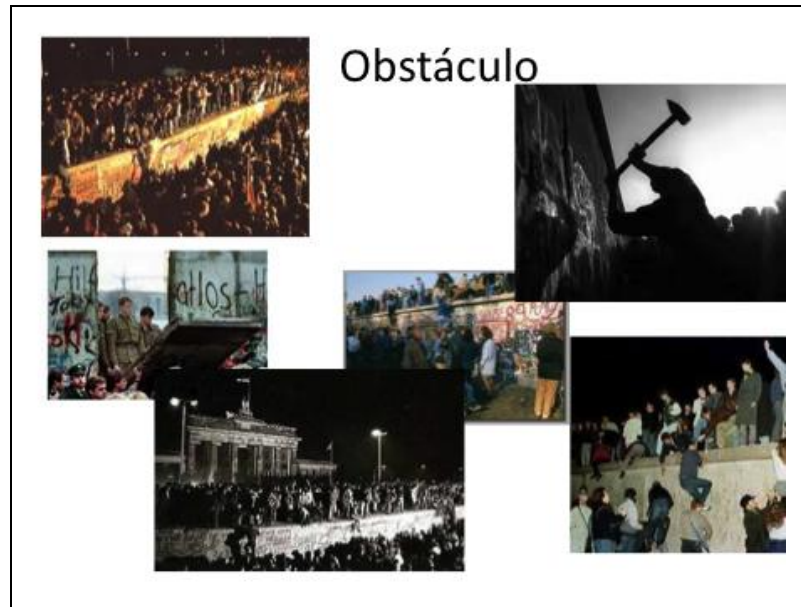
Figura 3: Inmediatamente después de la caída del Muro en 1989, la pared se transformó en un obstáculo que debía ser destruido.

La primera posibilidad consistía en dejar trechos del Muro tal como estaba, de forma que se degradara y desapareciera naturalmente (Figura 4). No habría ningún tipo de intervención. Esta alternativa fue implementada por los empleados del centro de documentación “Topografía del Terror”, logrando “preservar” un segmento que posteriormente fue declarado patrimonio histórico en 1990. La propuesta modela una narrativa en que la memoria se ve sometida a los efectos del tiempo y el desgaste. La transformación de la materialidad podría tener un rol significativo. A través de diversas generaciones (sobre todo de las que no protagonizaron los eventos), las implicancias de lo que fue el Muro irían desapareciendo, así como la “ruina” perdería su tamaño, espesura, monumentalidad hasta sólo ser un conjunto de escombros. De esta manera, el pasado podría ser superado por el futuro, y la herida podría cicatrizar.