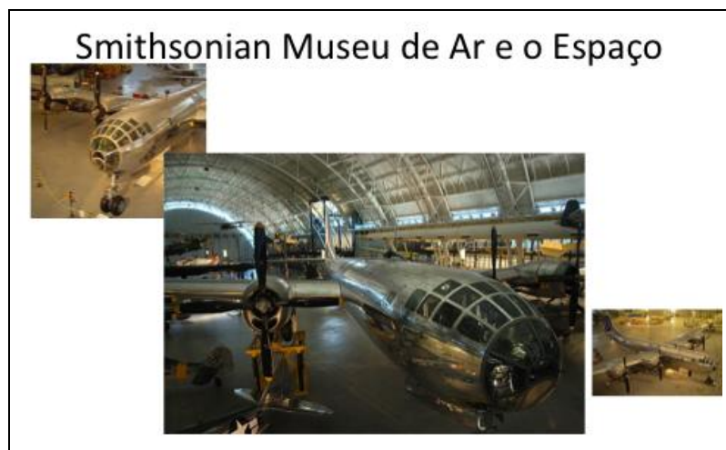
Figura 7: El Enola Gay, el avión que lanzó la bomba atómica sobre Hiroshima, es exhibido en El Museo Smithsoniano del Aire y el Espacio sin referencias a la masacre.

fundamentalmente técnicos y no involucran el uso específico al que eventualmente se encontraron destinados.