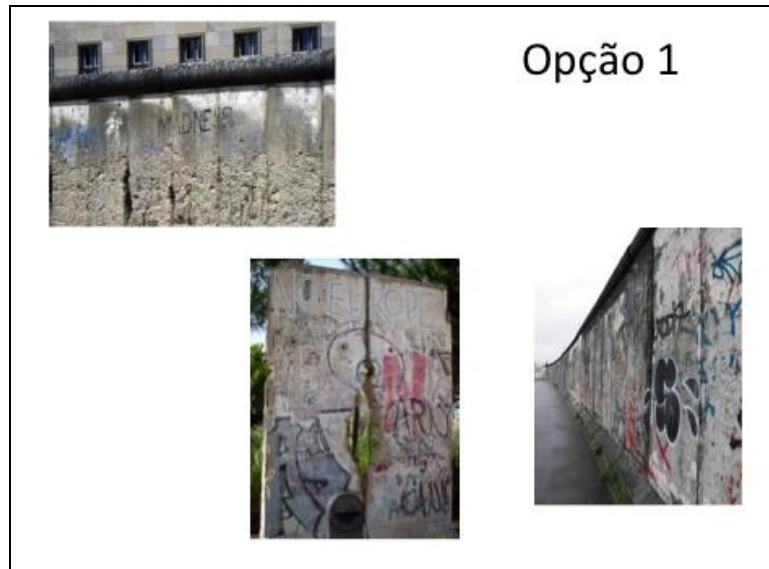
Figura 4: Frente a la necesidad social de preservar parte del Muro, algunos sectores propusieron que la construcción se dejara tal como estaba y degradara naturalmente.

Como segunda alternativa, el Senado alemán hizo marcar a lo largo del antiguo recorrido de la construcción, una doble línea de adoquines y placas de hierro fundido, con la inscripción “Muro de Berlín 1961–1989” (Figura 5). Estas marcas permitirían seguir a pie las huellas de la pared y las instalaciones fronterizas. La medida fue complementada con algunas otras. Primero: treinta placas informativas que definen la “milla histórica” dentro de los límites de la ciudad. Segundo: una serie de indicadores azules que marcan la ruta del Muro. Tercero: diez pilares que dan cuenta de puntos clave de la historia de la pared. Cuarto: una exposición al aire libre en el Checkpoint Charlie. Creemos importante señalar que la segunda alternativa es un avance del final esperado para la primera propuesta. La materialidad de la línea de adoquines transmite la impresión de una cicatriz curada. Se encuentra ahí para recordar algo que perdura en el presente como una marca visible de lo que fue, pero ya no está más.