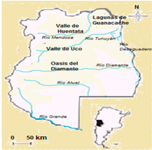
Figura 1. Ríos principales y zonas irrigadas de Mendoza a fines del siglo XVIII. Elaboración propia.