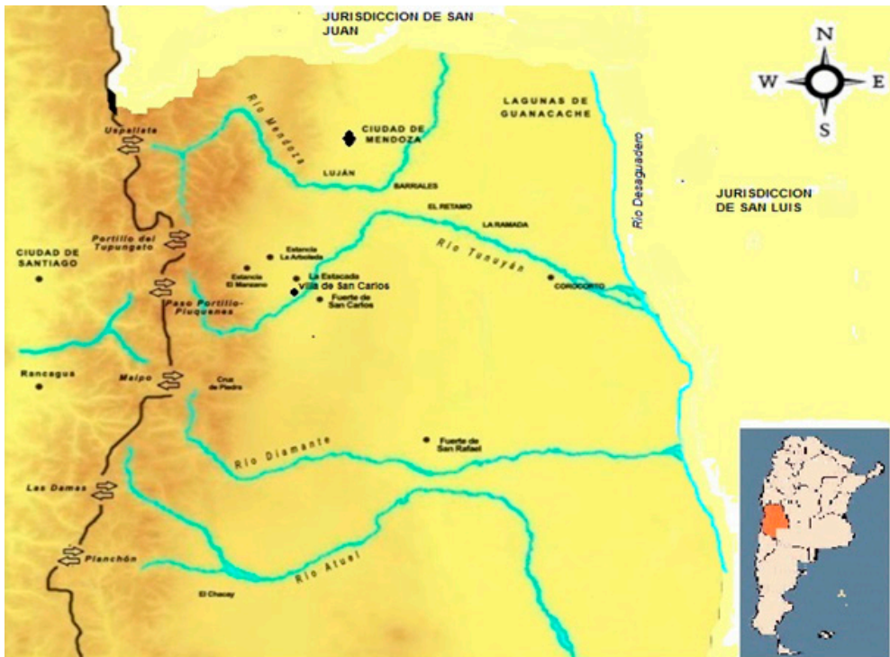
Figura 2. Pasos cordilleranos y puntos claves en el proceso de equipamiento político del territorio, 1800-1850. Elaboración propia.