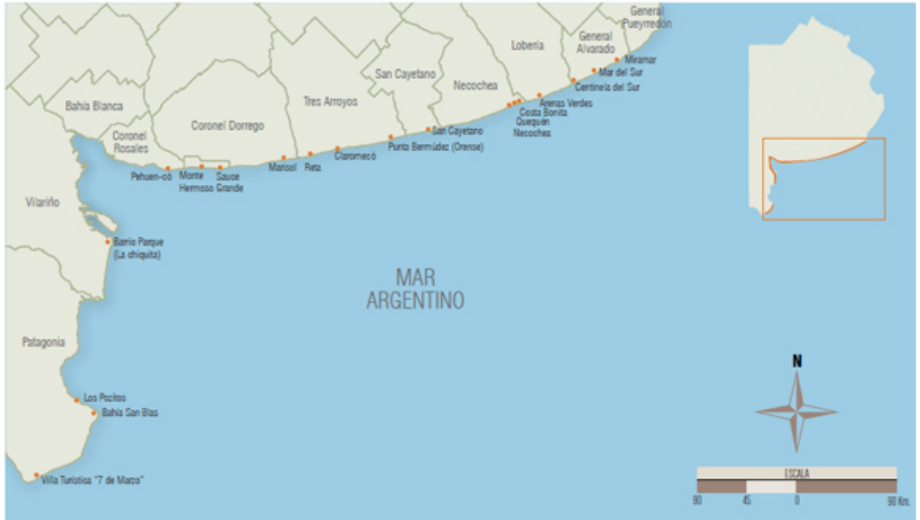
Figura 2. Ciudades balnearias de la Provincia de Buenos Aires II