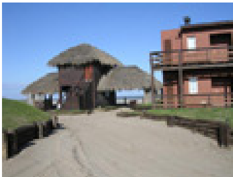
Figura 5. Acceso controlado

Las características edilicias y la ubicación tanto de apart-hotel como de las viviendas muestran que las mismas han sido proyectados como residencias temporarias; ya que la distancia a los servicios básicos (abastecimiento, salud, educación, etc.) son considerables y requieren de la utilización de vehículos particulares para acceder a ellos. (Figuras 5 y 6)