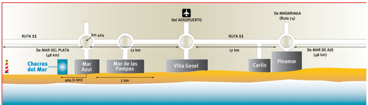
Figura 4. Ubicación del complejo

el esquema que aparece en la Figura 4 puede observarse su localización con respecto a la ciudad cabecera del municipio (Villa Gesell).