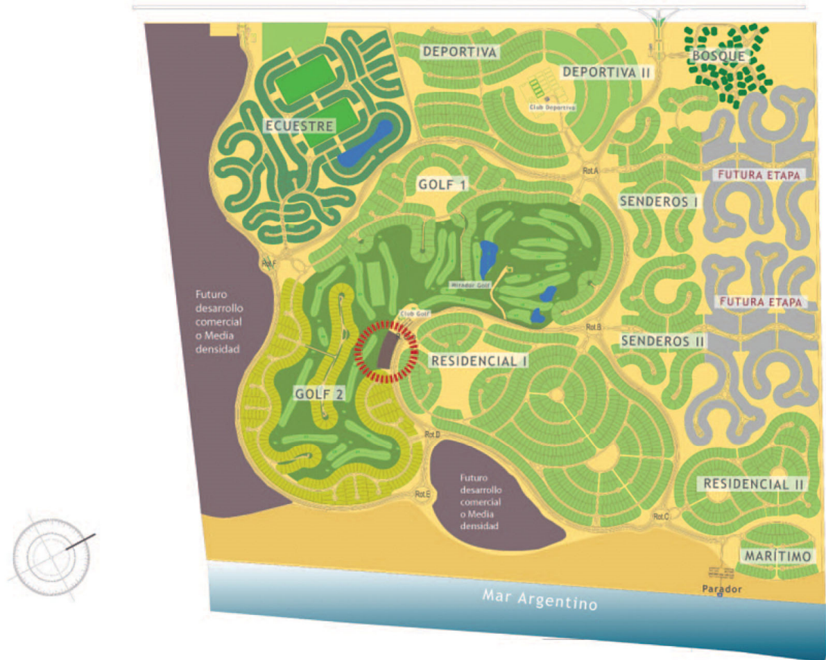
Figura 9. Master plan de Costa Esmeralda

y de golf, y que además abarca tres kilómetros de la costa marítima. Como complemento, el proyecto incluye la construcción de un hotel y spa de mar (Figura 9).