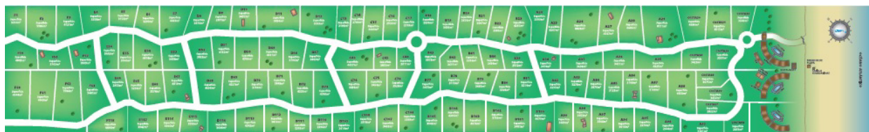
Figura 3. Chacras del Mar, urbanización privada

Como ejemplo puede citarse el exclusivo complejo Chacras de Mar, ubicado en el municipio de Villa Gesell (Figura 3), con un master plan que incluye un apart-hotel, residencias, playa privada, equipamiento deportivo, accesos controlados, vigilancia privada y una subdivisión del predio para construcción de chacras.