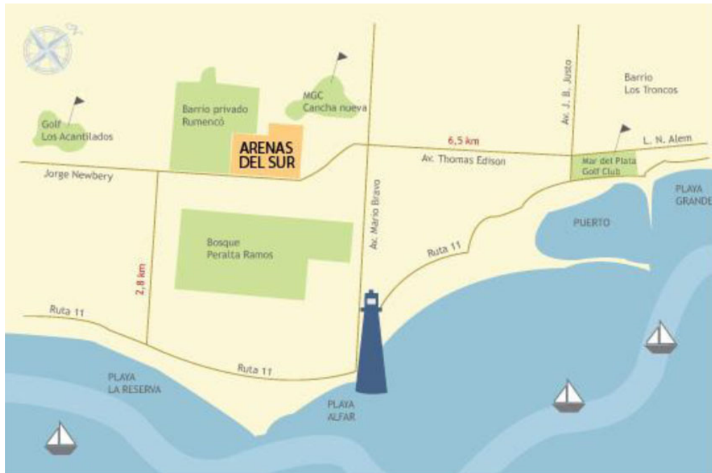
Figura 7. Barrios cerrados marplatenses