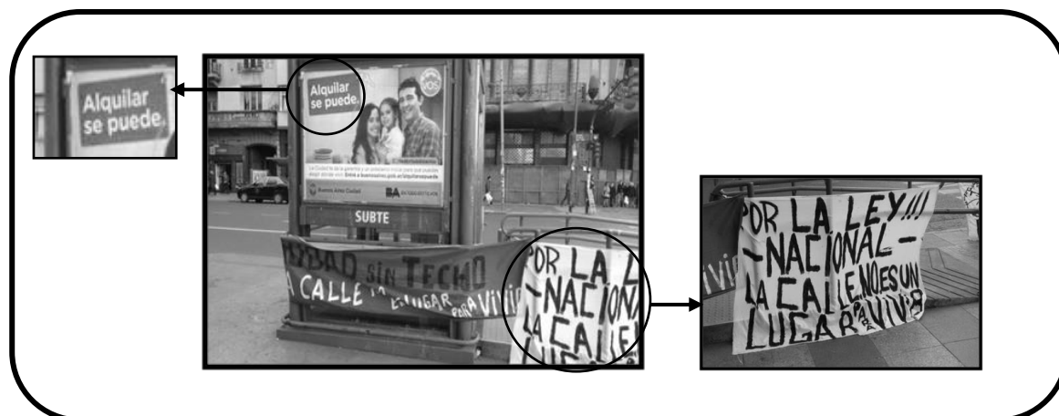
Figura 1. Reclamo bajo el lema ‘La calle no es un lugar para vivir’.

Paralelamente, si bien Cantor (2012) sostiene que la emergencia habitacional fue ratificada por el Poder Ejecutivo a través de decretos; en términos jurídicos, esta se encuentra vetada 4 . Por ello, también, quienes no lograron acceder al derecho a la vivienda digna requirieron, en varias oportunidades, una nueva declaración de la emergencia habitacional para que se priorizaran las políticas públicas en dicha materia. Estas expresiones cobran aún más valor si se sigue el concepto de Necesidades Básicas Insatisfechas (NBI) provisto por el Instituto Nacional de Estadística y Censos (INDEC), dado que el padecimiento de problemáticas habitacionales graves es comprendido como un indicador o señalador de pobreza. Esto quiere decir que quienes habitan en inquilinatos, hoteles, pensiones, viviendas no destinadas a fines habitacionales, viviendas precarias y quienes habitan en situación de calle son personas cuyas necesidades básicas no están cubiertas y, dicho en los propios términos de la entidad, ...los grupos humanos con NBI constituyen sujetos prioritarios de políticas públicas tanto sociales como económicas (INDEC, 2012, p. 309).