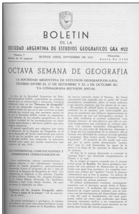
Fig. 1: Izquierda: Tapa del Boletín G.E.A N°1 (1934). Derecha: Tapa Boletín G.E.A N°7 (1943)