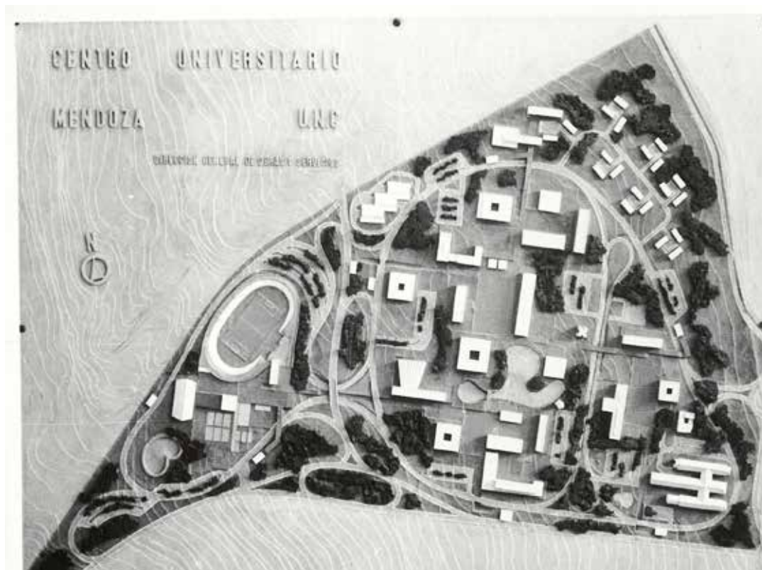
Fig. 5 Universidad Nacional De Cuyo