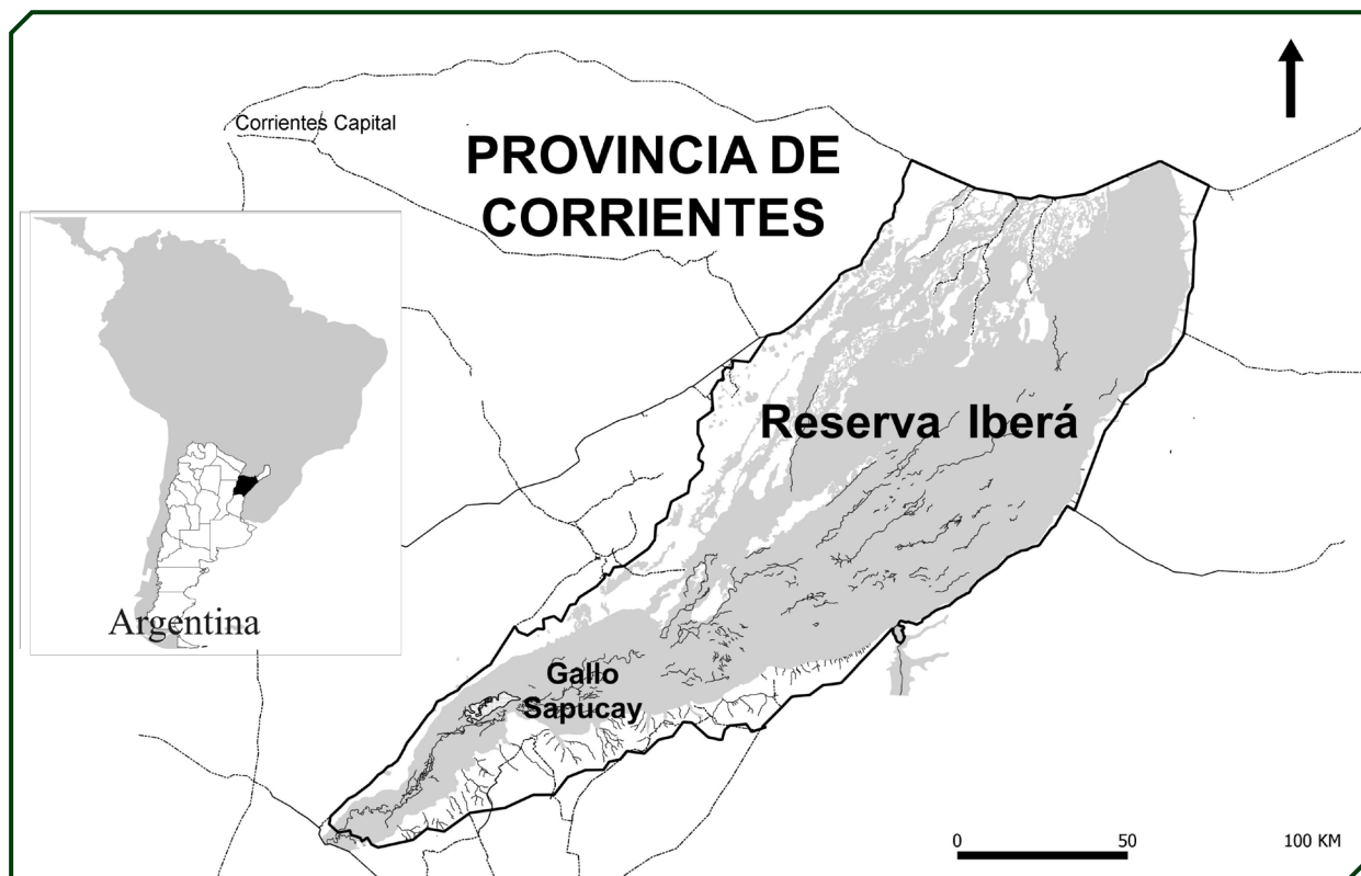
Figura 1. Ubicación del área de estudio "Gallo Sapucay", dentro de la Reserva Provincial Iberá, provincia de Corrientes, Argentina.

Desde el punto de vista sociocultural, esta zona es habitada por pobladores cuyas vidas dependen casi exclusivamente de los recursos naturales allí presentes. Antiguamente su sustentabilidad se complementaba con la caza con la finalidad de revender los cueros a distintas acopiadoras y secundariamente se ocupaban de la ganadería en campos de uso común, mientras que otros trabajaban de peones