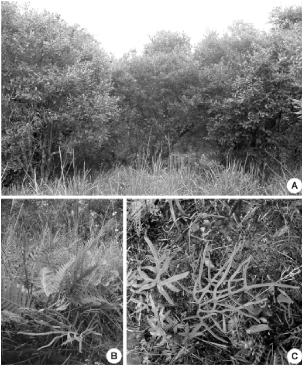
Fig. 3. A: bañado con cobertura arbustiva irregular de Citronella gongonha , ambiente donde fueron hallados ejemplares de Doryopteris lomariacea . B: ejemplar de D. lomariacea entre la vegetación herbácea. C: ejemplar aislado de D. lomariacea donde se visualiza el suelo anegado.

Ci. Nat. Bernardino Rivadavia Inst. Nac. Invest. Ci. Nat., Bot. 5(5): 105-122.