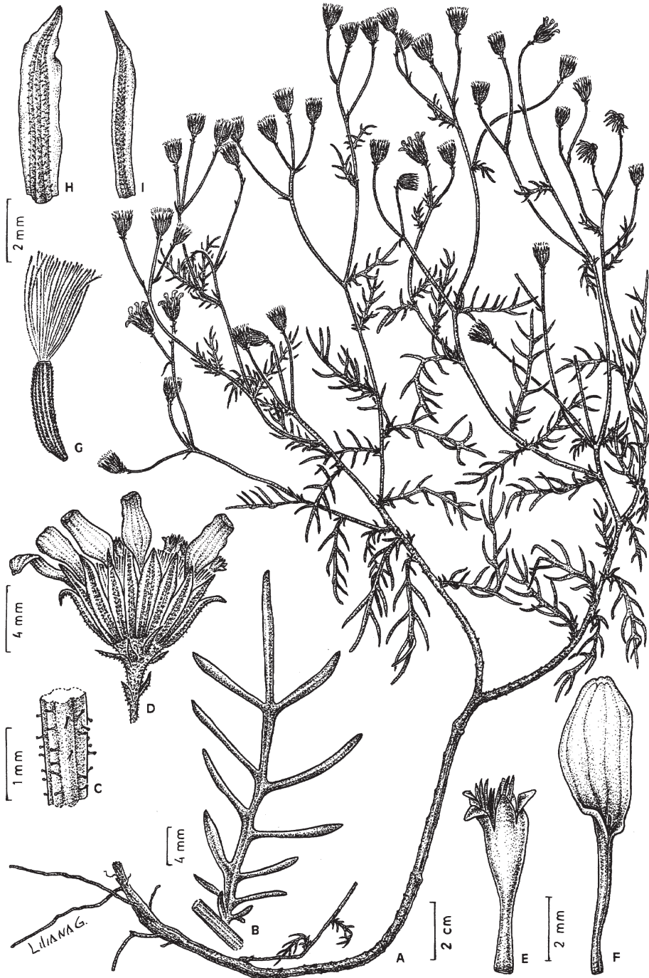
Figura 1. Senecio glandulifer Dematteis & Cristóbal. —A. Planta. —B. Hoja. —C. Sección de un pedúnculo. —D. Capítulo. —E. Flor central. —F. Flor marginal. —G. Aquenio con papus. —H—I. Filarios. Drawn from Schinini & Ahumada 16003 , CTES.

0.45 mm; anteras con apéndice conectivo ovado, obtusas en la base, de 2.3–2.5 mm; estilo de 5.2–5.5 mm, ramas truncadas en el ápice, con una corona de pelos colectores, de 0.6–0.8 mm. Pappus blanco,