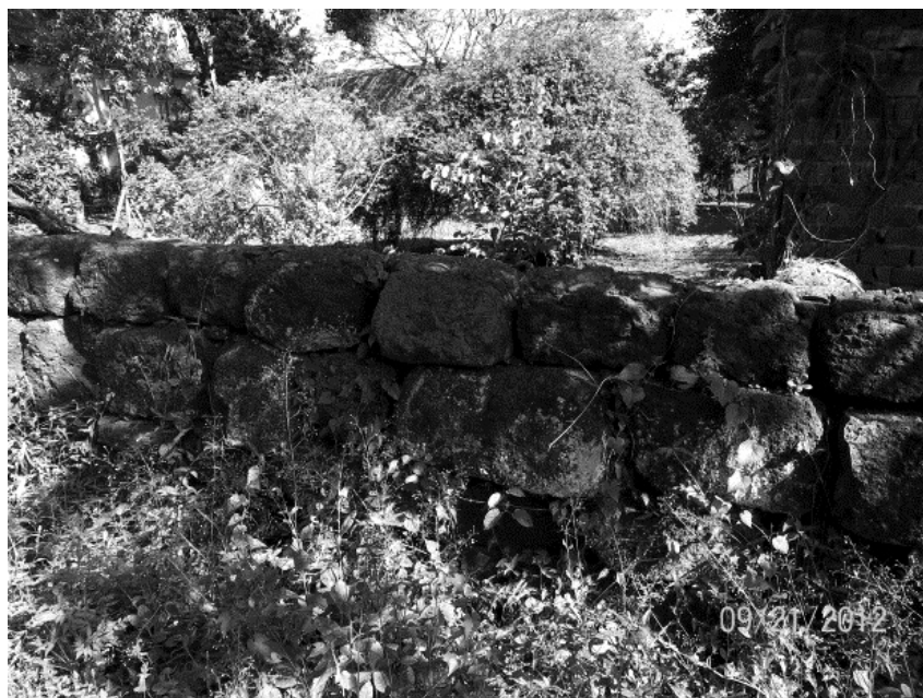
Figura 5. Patio de propiedad privada en donde se encuentran materiales como tejas y columnas de posibles construcciones jesuíticas.

A partir de lo expuesto por el CERPACU (Instituto de Rescate y Revalorización del Patrimonio Cultural) tomamos los siguientes puntos: