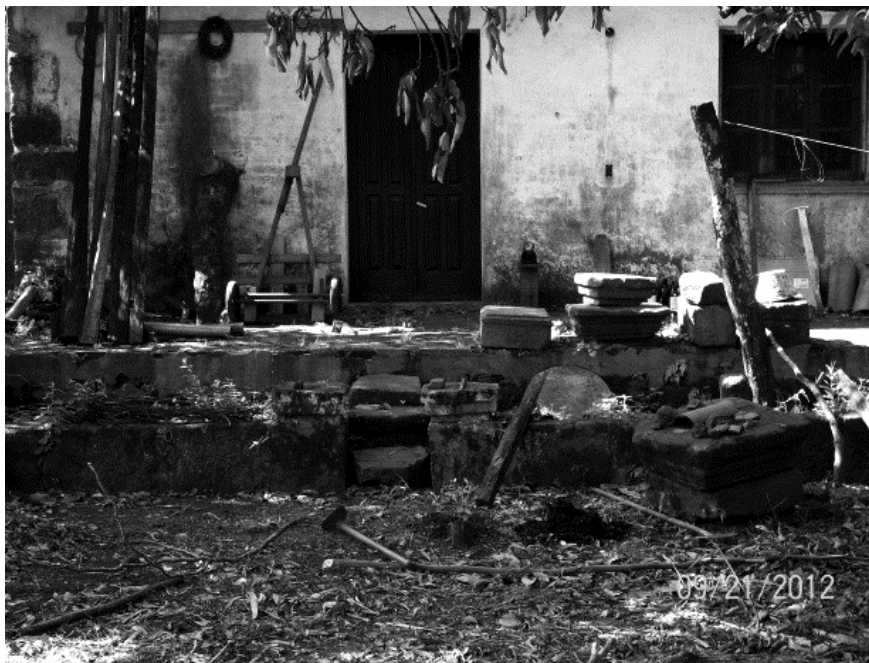
Figura 4. Antiguo muro con pórtico ubicado en la parte trasera de la propiedad de Marquez Noguera.