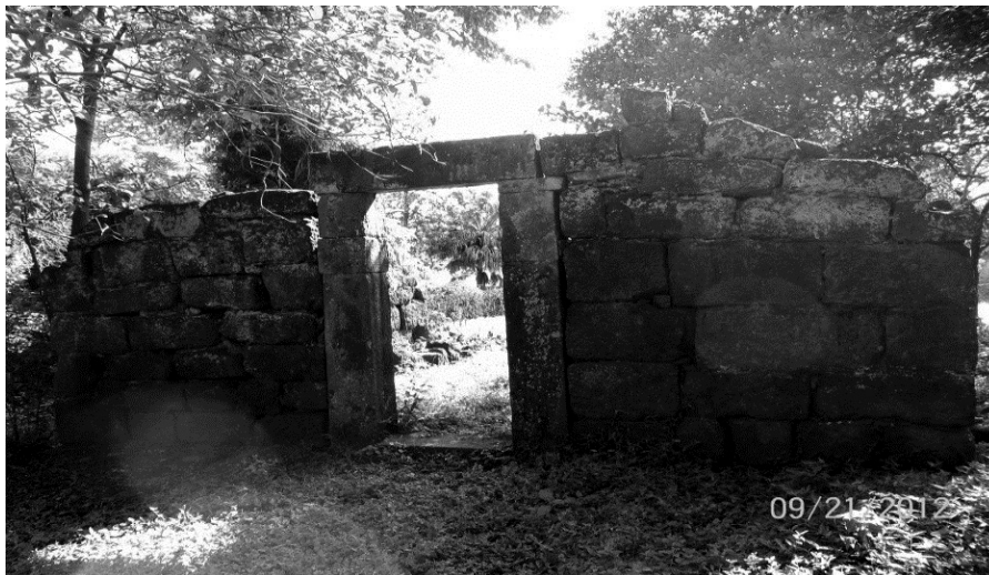
Figura 3. Muros realizados con piedras itacuru, del periodo de la antigua reduccion jesuítica, ubicados en el lado suroeste en frente de la plaza principal de Concepción de la Sierra.

todo el patrimonio jesuítico- guaraní de nuestra provincia no representa el total de la historia de los paisajes sociales de dicha región. Si bien nuestros estudios se centran en el periodo de contacto hispano- indígena, a partir de ese contacto de grupos europeos y autóctonos, somos conscientes de que detrás de esto se encuentra toda una historia milenaria, que abarca pueblos originarios, con elementos de continuidad y ruptura, cambios y resistencia.