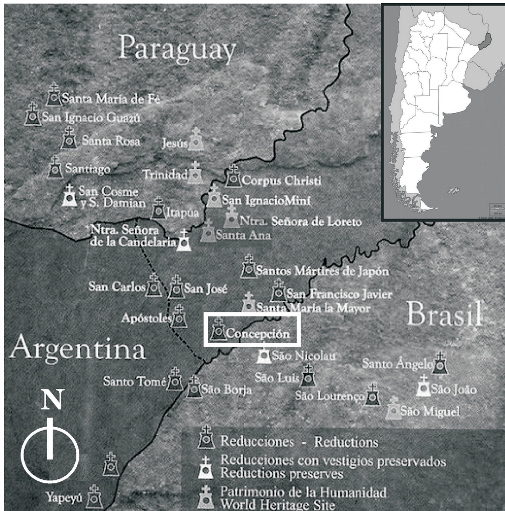
Figura 1. Ubicación de la localidad de Concepción de la Sierra en la provincia de Misiones.