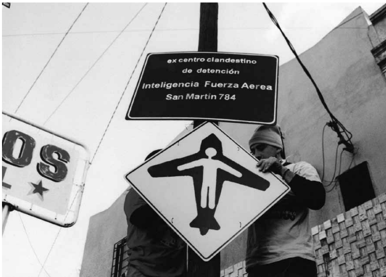
Escrache a la fuerza aérea en Morón (regional bs. as. de inteligencia). 19 de abril de 2003.

ausencia-presencia como pares de opuestos que activan el pasado en función de un futuro. “En efecto, las memorias no son sino productos de construcciones selectivas y contingentes y, por lo tanto, siempre ficcionales. Las maneras en la que se recuerda, lo que la memoria cede al olvido y lo que privilegia para retener definen en el presente tanto a los individuos como a las sociedades.” (Durán.V, 2008: 133). La cuestión es el modo en el que irrumpen en el espacio público recordando no sólo la operación de borradura provocada por el terrorismo de Estado (1976-1983) sino que encuentran una potencia creativa en su impulso de expresión.