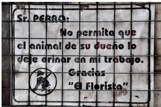
Reclamo de un florista en las calles de Buenos Aires.

los circuitos de los museos 3 donde la propuesta artística no interacciona con el transeúnte como si sucede con las intervenciones callejeras.