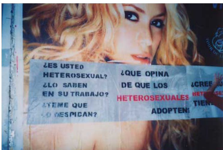
Intervenciones sobre la vía pública realizadas por el colectivo Mujeres Públicas

de las mujeres que les han negado durante siglos. Reconociendo el escaso espacio que se les había otorgado relegando sus roles a lo doméstico, al ámbito privado siendo lo público, el ámbito de desarrollo masculino. El año pasado, el Bid (15.5.2010) presento un artículo “Género y Negocios. Casos exitosos en los Cuatro Continentes.” Desde su perspectiva la equidad de género es un buen negocio ya sea para mujeres, hombres, familias, y empresas. No obstante, la revisión del mercado laboral en los distintos continentes presenta diferencias. Ya que en América Latina y el Caribe las mujeres enfrentan muchos desafíos y estereotipos ya que son empleadas pero en el sector informal donde las condiciones de trabajo son precarias. Se sabe que históricamente en la distribución histórica de afectos, funciones y facultades (tocó a la mujer dolor y pasión) contra razón, concreto contra abstracto, adentro contra mundo, reproducción contra producción. La intencionalidad es leer en el discurso femenino el pensamiento abstracto, la ciencia y la política, tal como se filtran en los resquicios de lo conocido. (González, E y Ortega, E.1984.) Al confrontar las brechas, la sociedad migra de lo individual a lo colectivo y busca suturar las heridas de la desigualdad hilvanando el hilo de la cohesión social.