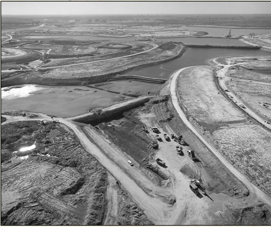
Figura 3. Grandes rellenos y lago central. Urbanización cerrada Nordelta.

alteración de líneas de costa del río Luján, el cambio en el trazado de varios cursos de agua que atraviesan esas tierras, entre otras (ver Figuras N° 3 y N° 4).