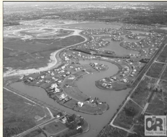
Figura 4. Cambios de líneas de costa del río Luján. Urbanización cerrada Villanueva.

Esa expansión de UCs sobre rellenos se concretó mayoritariamente sobre amplias extensiones de tierras inundables que para comienzos de la década de 1990 se encontraban todavía vacantes (en especial bajo dominio privado), pero también sobre tierras destinadas a usos productivos (forestales, viveros, huertas, etc.) y recreativos (recreos sindicales). Al mismo tiempo, en algunas oportunidades, las UCs avanzaron sobre terrenos contiguos a barrios pertenecientes a grupos socioeconómicos medios y medio-bajos e, incluso, asentamientos informales (“villas miserias” y asentamientos precarios), correspondientes a la expansión urbana protagonizada por los grupos populares en etapas históricas anteriores. A diferencia de los grandes rellenos de las UCs, en esos barrios y asentamientos informales es posible encontrar viviendas edificadas con otros sistemas constructivos para mitigar las inundaciones (palafitos, planta baja para usos no permanentes, pequeños rellenos, etc.), pero también existen numerosas viviendas que se hallan directamente al ras del suelo.