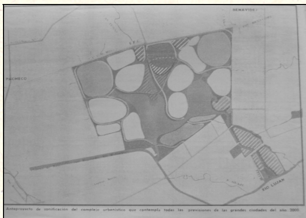
Figura 5. Anteproyecto de zonificación del Complejo Urbano Integral Benavidez (1977).

Tal como aparece en el primer mapa de zonificación del complejo urbano a modo de anteproyecto (ver Figura N° 5), se pueden advertir los distintos barrios o macizos de urbanización (con escaso grado de detalle) y el lago central (de formas simples) conectado a través de canales con el río Luján y con el nuevo canal Aliviador (el cual todavía no se encontraba unido al río Reconquista).