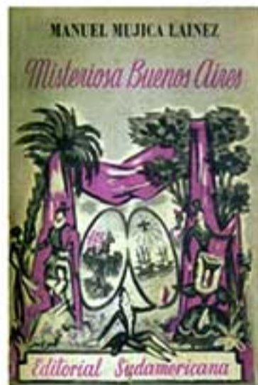
Tapa de la primera edición de Misteriosa Buenos Aires (1951).