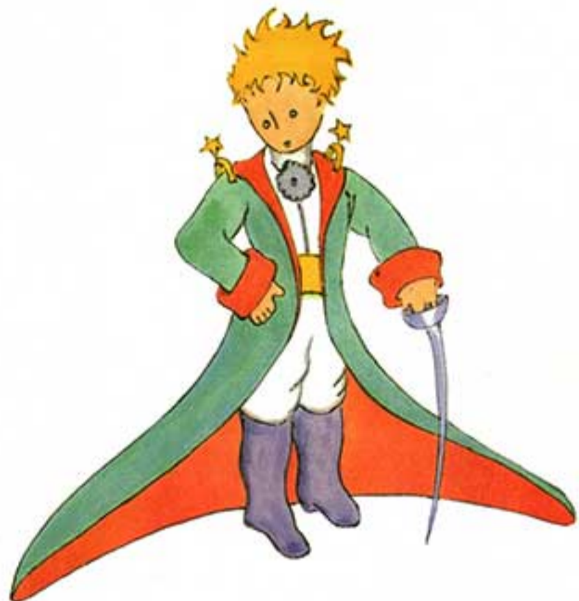
Dibujo original de Antoine de Saint-Exupéry para ilustrar Le Petit Prince (1943). Es para destacar el parecido en la posición de los brazos y la espada con la figura del azulejo.

5-Ramos, Carmen María (2005) "Azulejos: Pedacitos de luz", en revista Antiquaria, año 1 N°2, Buenos Aires, pp. 60-67.