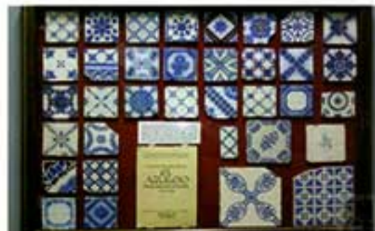
Vitrina existente en el IAA donde desde 1988 se expone parte de la colección de azulejos publicada en el libro