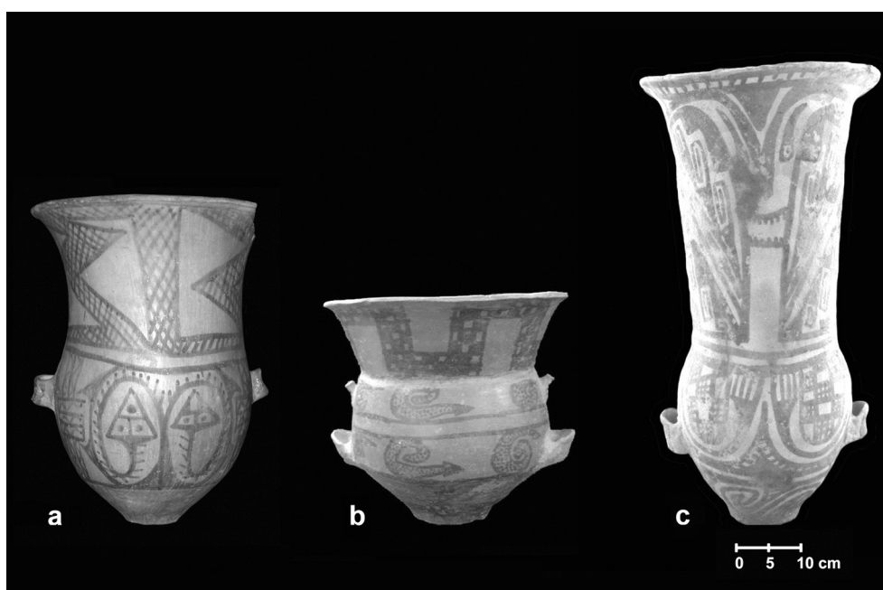
Figura 1. Ejemplos de urnas. a: Negro sobre Rojo tardía de Yocavil, Fuerte Quemado, Museo Etnográfico “Juan B. Ambrosetti”, N° 44-1924, col. Breyer. b: Belén, IAMUNT, col. Schreiter (Base de datos IAMUNT 2003). c: Santa María, Rincón Chico, Museo “Eric Boman”.

Las alfarerías Santa María y Belén comparten expresiones estéticas, simbólicas y pautas de uso. Ambas producciones constituyen los estilos con baños y pinturas mayoritarios en sus respectivas áreas de referencia. Comparativamente la frecuencia de hallazgos de tinajas Negro sobre Rojo Belén – Santa María es muy baja. En base a una revisión bibliográfica y de colecciones de museos hemos identificado 43 ejemplares completos. Estas urnas comparten con las tinajas Belén el uso de pintura negra sobre un fondo rojo alisado o pulido, la aplicación de baño rojo en la superficie interna del cuello, la distribución de los campos decorativos, ciertos motivos y modos de representación. Por su parte, comparten con las tinajas Santa María bicolor rasgos como el predominio de cuerpos ovaloides, la tendencia al desarrollo de los cuellos largos, ciertos modos de representación de la serpiente y de “guerreros” en algunos ejemplares. A pesar del “equilibrio” de rasgos de ambos estilos en las urnas Negro sobre Rojo, no ocurre lo mismo con el ámbito geográfico en el cual circularon, siendo los hallazgos mucho más frecuentes en la zona de Yocavil y alrededores (Figura 2). El estudio de varios contextos de hallazgo indica que esta modalidad estuvo vigente posiblemente entre los momentos finales del Período Tardío, la época de expansión incaica en el Noroeste argentino y el Período Colonial Temprano (Marchegiani et al. 2009).